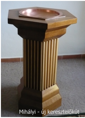
Mihályi - új keresztelőkút

Csodásan működik, mert eleink 75 éve, 1938-ban tornyot is építettek az imaházként is működő iskola mellé, azóta minden reggel harangszó ad hálát az új napért, hívogat a gyülekezeti alkalmakra, jelzi a veszélyt, és sajnos, gyakran kíséri utolsó útjára elhunyt testvéreinket.