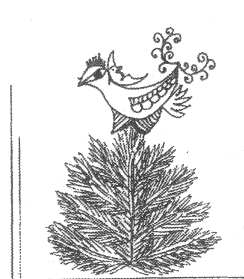
Balogh Órse (Oroszlána)