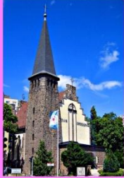
Óbudai Evangélikus Templom