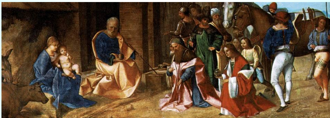
Királyok imádása (The National Gallery London) – Giorgione (Giorgio di Castelfranco)