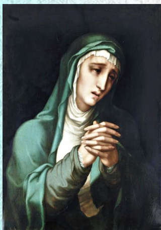
Luis de Morales: Mater Dolorosa

Külön örömet jelentett számunkra, hogy az előadott művek között elhangzott Kodály Zoltán Stabat Mater című vegyeskara is (a Stabat Mater siralomének, amely Jézus anyjának, Máriának a keresztfa mellett átélt fájdmáról szól). A