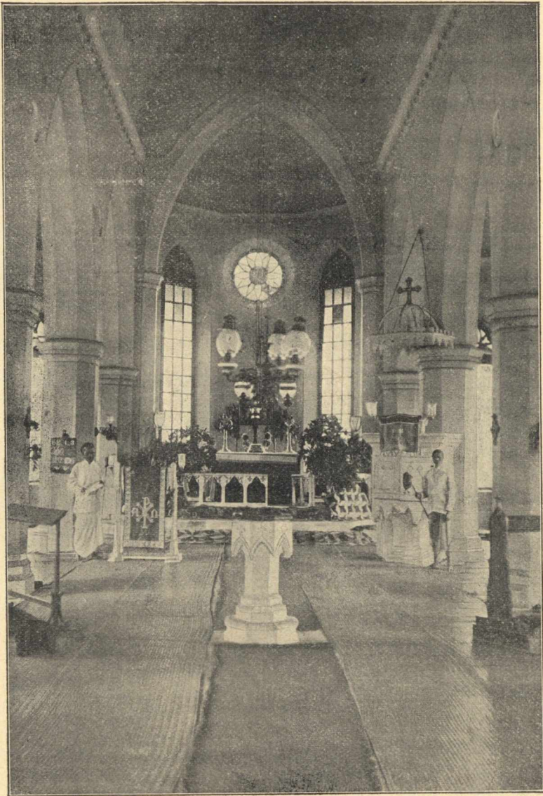
A tandzsauri luth. „vigasztaló templom“ belseje.

ványkeresztények egyházi szükségleteikre is áldoznak, így magában Kvala-Lumpurban templom építésére 2 év alatt 5000 márkát gyűjtöttek. Minden felnőtt egyháztag évi keresményének tizenketted részét adja e célra.