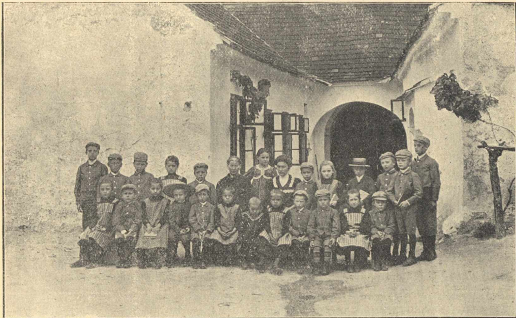
A modori árvák az udvaron.

utolsó négy hónapban 21, míg 1909 folyamán már 27 árvának adtunk teljes ellátást, úgyhogy az árvák ellátására a kiadás 1795 K 84 f-rel szaporodott. Hála a Mindenhatónak, hogy a kiadás nagyobbodásával nagyobbodtak az adományok is. Az apró adományok 5,944 K 21 f-t tettek ki, 2,633 K 03 f-rel többet, mint az előző évben s ezenkívül 714 K 45 f-t gyűjtöttünk az intézet számára megveendő házra, 237 K 38 f-t pedig az árvák karácsonyfájára. — Egy árva egész évi ellátása 178 K 06 f-be került 11 K 40 f-rel többbe, mint a múlt évben, ami az élelmiszerek óriási mértékben való megdrágulásának tudható be.