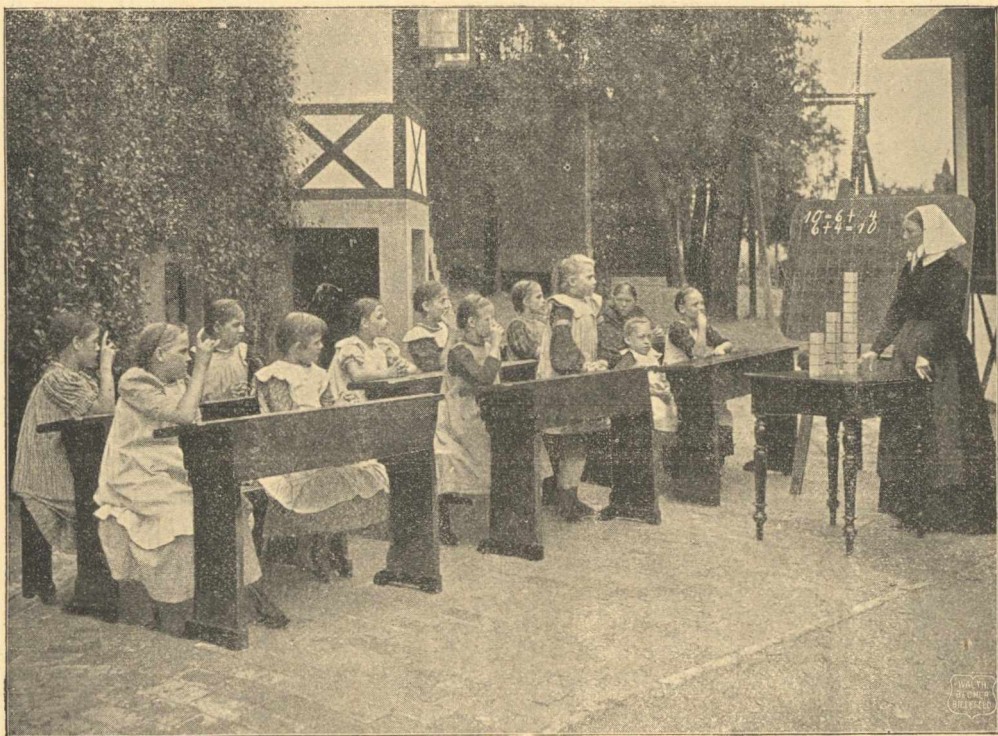
Diakonissza tanítónő az iskolában.

Egy hazai misszióbarát intézte egyszer ezt a kérdést hozzám. Akkoriban még nem tudtam, milyen különbségre céloz; másrészt, nem ismertem sem az evang. diakonissza, sem a kath. irgalmas nővér munkáját.