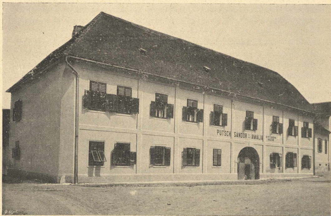
A pinkafői árvaház.

Ha az egyházmegye mind ebbe belemenne, akkor ajánlanám egy nagy és kis árvügyi bizottság választását; míg ez utóbbi a pinkafői összegyházközség kötelékéből volna választandó (talán 12 tag), az előbbi az egyház-