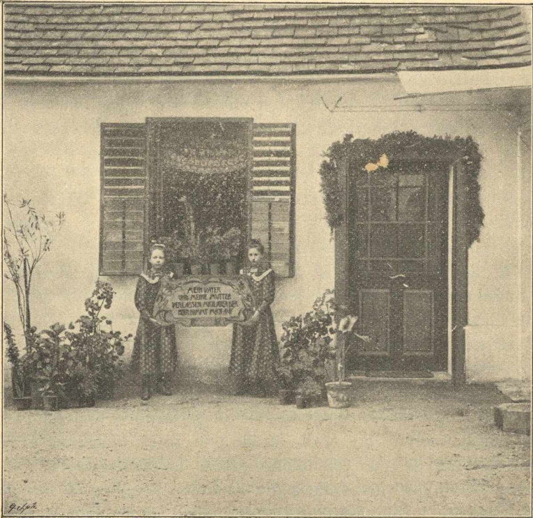
Az első árvák.

Kötelességemmé tettem az egyházmegyei árvaház létesítésének útját, módját részletesen megjelölni. Nem tagadom, „nagy erőtlenséggel, félelemmel és rettegéssel“ fogok e munkához. De hiszem, hogy sikerül e munka s megértenek az én igen tisztelt lelkész testvéreim s világi uraink, ha fellemelem szemeimet az oszlopra, honnét jön nékem segítségem s hiszem, bizvást hiszem, hogy velem együtt fohászkoznak: „Az én segítségem az Úrtól vagyon, ki teremtette a mennyet és a földet.“ Uram, jelenj meg nékem s „adjad, hogy nyerjem meg azt ma, amit én kívánok és cselekedjél irgalmasságot velem.“