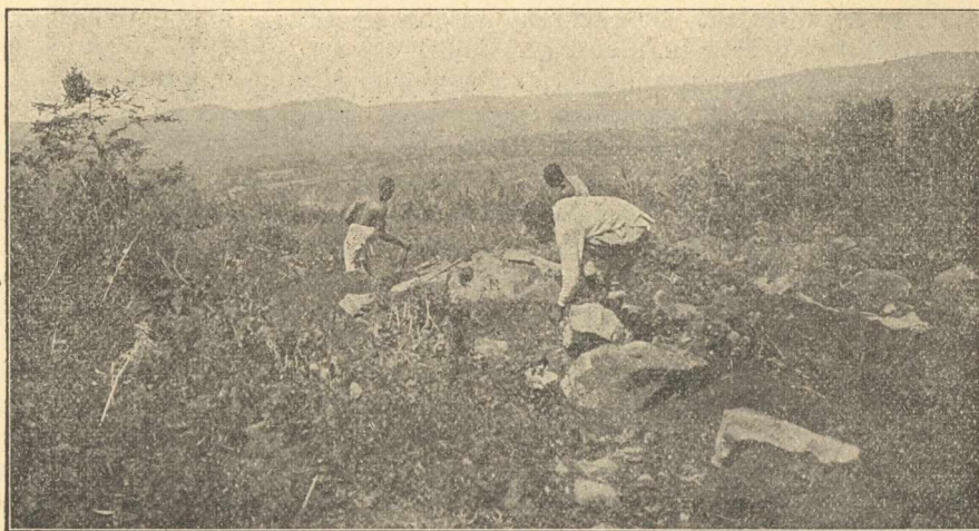
A mambai templomhoz követ fejtő munkások.

való előkészítés alatt. A hivek buzgóságát mutatja, hogy 148 urvacsorára jogositott felnőtt egyházttag mellett 322 volt az urvacsorázók száma, a pogányok érdeklődését pedig az, hogy vasárnaponként átlag 450-en látogatták az istentiszteletet. A tanulók száma itt 251. Természetes, hogy a hittérítők a vasárnapi istentiszteleten s a gyermekek tanításán kívül, hétköznap is tartanak bibliaórákat, a külállomásokon a pogányoknak is szorgalmasan hirdetik az ígét s mindent megtesznek, hogy az áttérteket gazdaságilag és szociális tekintetben is emeljék. Hogy fáradságuk nem hiábavaló, mutatja az, hogy pld. Mamba állomáson bennszülöttekből harsonakar alakult, hogy ugyanott a keresztyének s katechumenusok 64 rupiát gyűjtöttek maguk között egy iskalaharmónium beszerzésére, s hogy legujabban, ha még maga Koimberesz törzsfő nem is, de legalább egyik fivére a katechumenusok közé lépett.