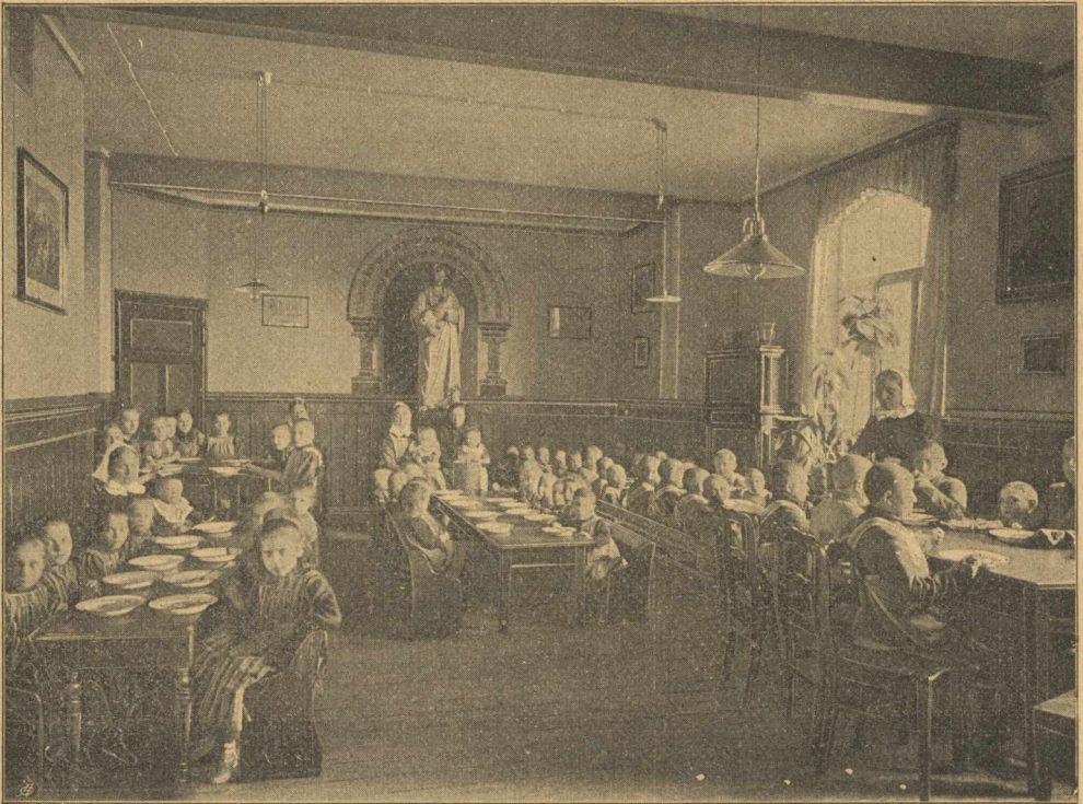
Árvagyermek az étteremben.

meki örömmel várják szent karácsonyt, üdvözítőjük születése napját. Mintha éreznék mindegyik, hogy azt az önfeláldozó szeretetet ápolóik, nevelőik részéről, a róluk való gondoskodást, szent karácsony napjának köszönhetik. Istent, kit a bölcs lángesze fel nem ér, ismerik Bethel szegényei, nyomorultjai. Jézust, kinek Istenségét, csodahatalmát a jólétben élők ezrei megvetik; kinek keresztalálát s feltámadását oly sok tanult ember nevetség tárgyává teszi, azt a keresztre feszített, de feltámadott Jézust Bethel betegek, hülyéi, nyomorékjai szeretik, ajkaik dicsérik, hálákat adván Istennek, hogy egyszülött fiát küldé e világra, hogy felébresztette az emberek szívében a felebaráti szeretetet. Ha emelkedik is azoknak száma, kik megtagadják,