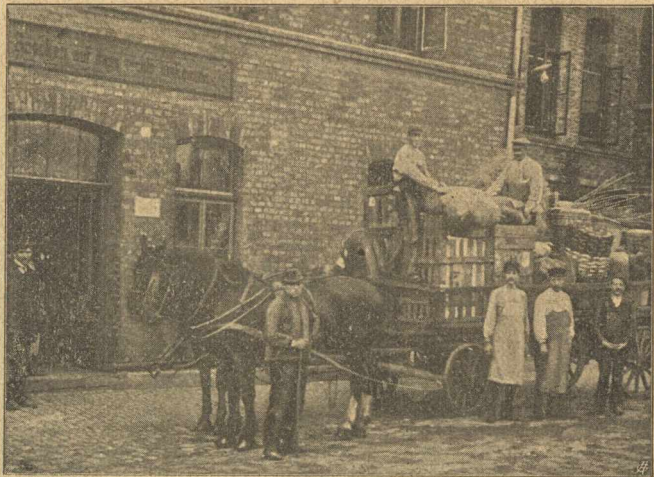
A „Maradék darabok“ beszállítása.

amellett, hogy anyagiilag támogatják, egyuttal módot nyújtanak a betegek foglalkoztatására. Gondoljuk csak el a szegény epileptikusok helyzetét, kik az iskolából, templomból, munkából, hivatalból ki vannak zárva, éppen betegségük miatt, s többre nem becsültetnek, mint egy elromlott butor darab, mely sutba dobatik; mily felemelő rájuk