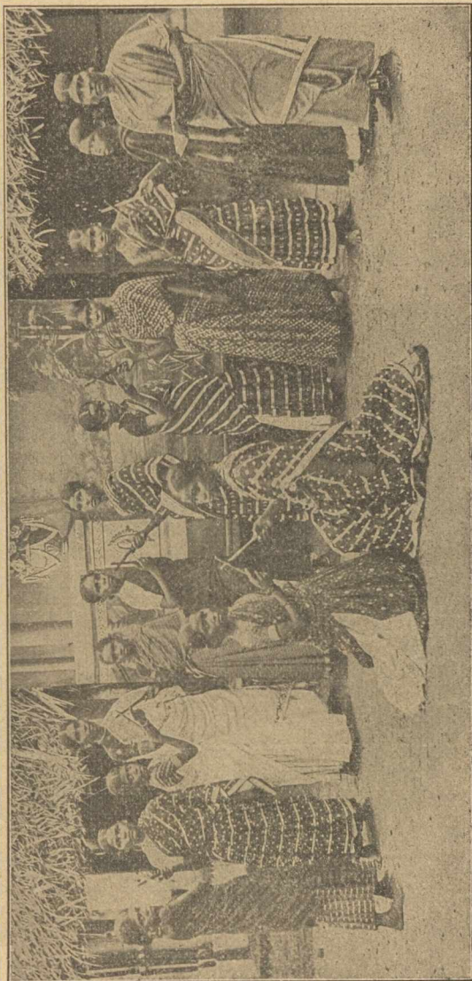
A tandsauri kosztos leányiskola növendékei.

A tanítás kiterjed az írás és olvasásra, a hol az illető ind nők előbb valamely iskolában nem sajátították el e mesterségeket, továbbá különféle kézimunkákra ; föltétel mindenütt a keresztény vallásba való bevezetés, mely főképp bibliai történetek elmondásával s magyarázatával s bibliai olvasással történik. A mint e nélkül pogány leány nem vétetik fel leányiskoláinkban, ugy a keresztény vallástanítás nélkül nincsen tanítás a szenanában. Hogy pedig misszionárius nőink minél több házat vonjanak befolyásuk alá, segítségükre vannak a bibliás nők , többnyire özvegyek, kik férjhezmenetelük előtt esetleg tanítónői kiképzést nyertek volt, vagy néha olyan benszülött keresztény tanítónők is, kik szegény pogány nőtársaik iránti irgalomból