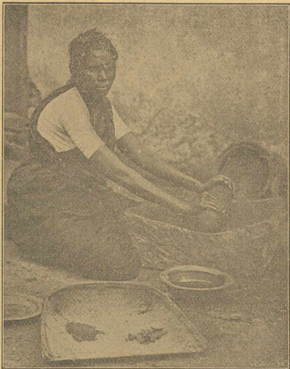
„Karrit“ készítő tanul nő.

A házasság rendesen még fokozza az ind nőnek szomorú sorsát, mivel szellemileg s testileg éretlen korban adják őket férjhez, a magasabb kasztokban néha már 4—5 éves korukban. És habár a házassági együttélés a legújabb ind császári törvény szerint a leánynak csak 12-dik életévében veheti kezdetét s így a 10 éves anyák, melyek egy negyedévszázad előtt még elég gyakoriak voltak ma már ritkaság számba mennek, sokszor mégis szörnyű testi rombolásnak szemtanúi a misszói kórházak orvosnői. De más tekintetben sines valami jó dolga a fiatal nőnek, ki férjével, kinek okvetlenül saját kasztjabelinek kell lennie, a legtöbb esetben csak a „férjhez menetel“ napján ismerkedett meg. Miután pedig a háztartás vezetéséhez természetesen nem ért, anyósa viszi az uralmat a házban, ki menyével már csak azért is durván bánik, mivel fiatal korában őt se részesítették finomabb bánásmódban. Férjéhez való viszonyát igen jellemzik azon szabályok, melyek e tekintetben Indiának „Padma Purána“ című régi szent könyvében található s melyek közül egynéhányat mi is közlünk*): „A nőnek nincs más istene e földön mint férje. Ha neki föltétlen engedelmességgel szolgál, összes jó cselekedeteinek legtökéletesebbikét végzi s egyuttal egyetlen istentiszteletét is“. — „Ha férje akár pupos is, vagy vén, nyomorék és ügyetlen magaviseletű; ha hirtelen haragu, pazarló és könnyelmű is; ha iszákos,