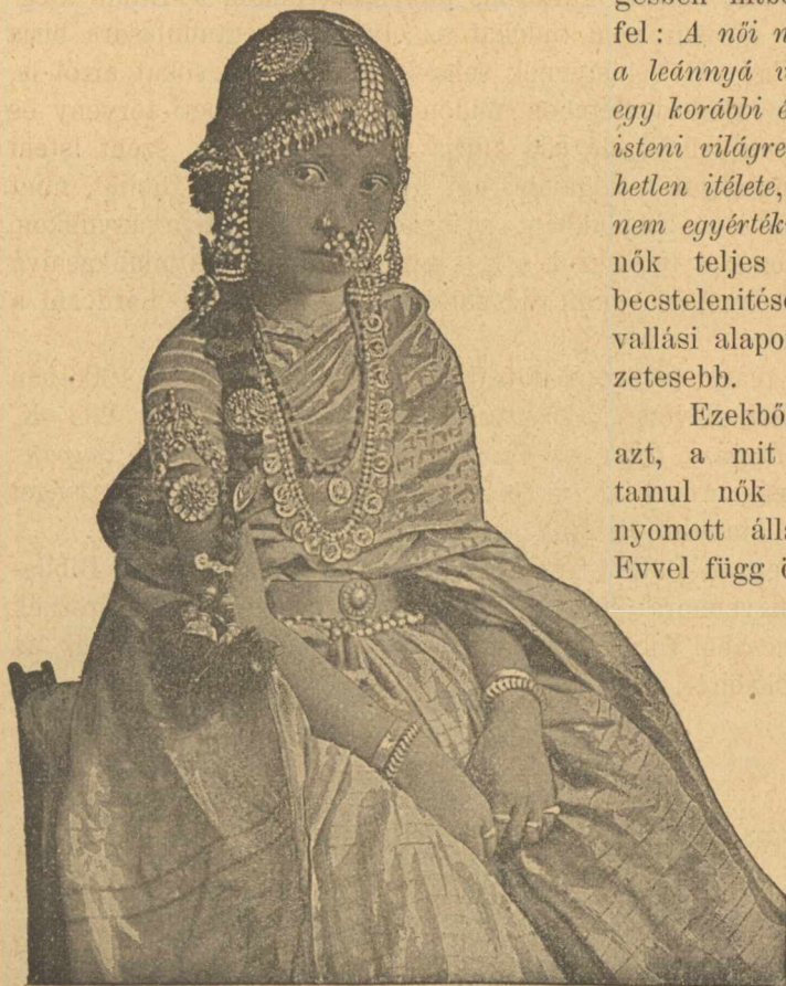
Tamul leány teljes diszben.

indiai nők műveletlensége. Sem a mohamedánok, sem a pogányok, sem a magasabb, sem az alsóbb kasztok nem tartják szükségesnek a lányok iskoláztatását. A keresztény misszió előtt nem is volt Indiában leányiskola, noha különö-