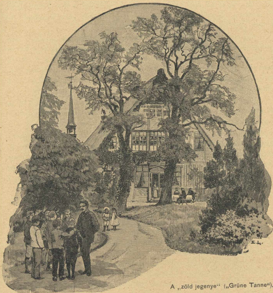
A „zöld jegenye“ („Grüne Tanne“).

Valamint nem változott a „családapa“ neve, ugyanúgy változatlanul megmaradt az a szellem is, a mely a „Rauhes Haus“-