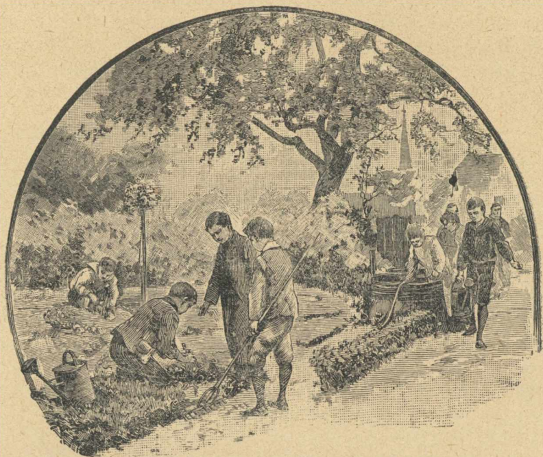
A „családi kertben“.

És meg is csinálta. De hiszen volt is már benne gyakorlata. A „Rauhes Haus“ imatermében látható egyszerű tábla, a mely az 1870/71-i háboruban szent hivatásuk teljesítése közben elesett „testvérek“-nek emlékezetét őrzi, a milyen szomorú, éppolyan dicsőséges dokumentuma a sebeket kötöző, másokért élő, önfeláldozó szeretet munkájának.