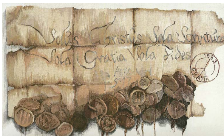
Polgár Rózsa: Tisztelet Luthernek (gobelin, 1983)