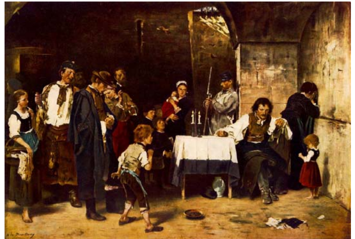
Munkácsy Mihály: Siralomház (1869). E kép hozta meg számára a sikert és elismerést a Párizsi Szalon kiállításán.

Munkácsy Trilógiájának nevezett sorozata: Krisztus Pilátus előtt , Ecce Homo (1895-96) és a Golgota (1883-84) most együtt, azaz egyszerre láthatóak a bécsi gyűjteményes kiállításon. Témájukban éppen beleillenek a húsvéti hétbe és ezért különösen stílszerű volt a kiállítást március 29-én megnyitni. A gyűjteményes kiállítás 2012. június 3-ig lesz megtekinthető a Künstlerhausban. Azért is érdemes megnézni, mert a képeknek egy részét az USA-ból hozták vissza Európába. Munkácsy rengeteg képet adott el Amerikában, amit az utóbbi évtizedekben Pákh Imre műgyűjtő vásárol fel a Munkácsy Alapítvány javára.