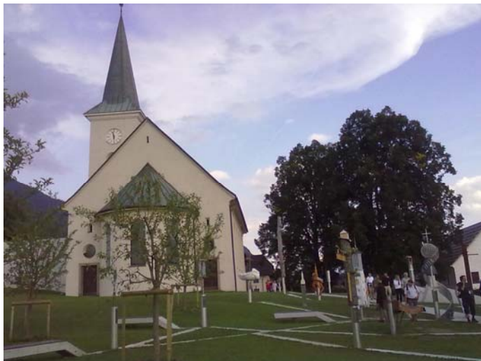
A gyülekezetek útja a települések földrajzi elhelyezkedését követi

A jelennel találkozás másik motívuma, hogy a történelem és ma összekapcsolódását, valamint a személyes beszélgetés lehetőségét a bennünket vezető fiatalok képviselik. Csaknem 100 önkéntes 16-19 éves fiatal jelentkezett Karintiából, hogy egy négynapos tábort valamint több tréninget követően a kiállítást bemutató kalauzokként kísérjék az érkező csoportokat, személyeket. Mindig ketten vannak, egyikük történelmi ruhába öltözve az elmúlt idők eseményeit, jellegzetességeit eleveníti fel, míg a másik – mintegy dialógusban állva a történelmi korrallal – arról beszél, hogy az egykor megtörténteknek milyen hatásai vannak, hogyan épültek bele a mai evangélikusság életébe és milyen jövőbeli feladatokat és reményeket jelenthetnek.