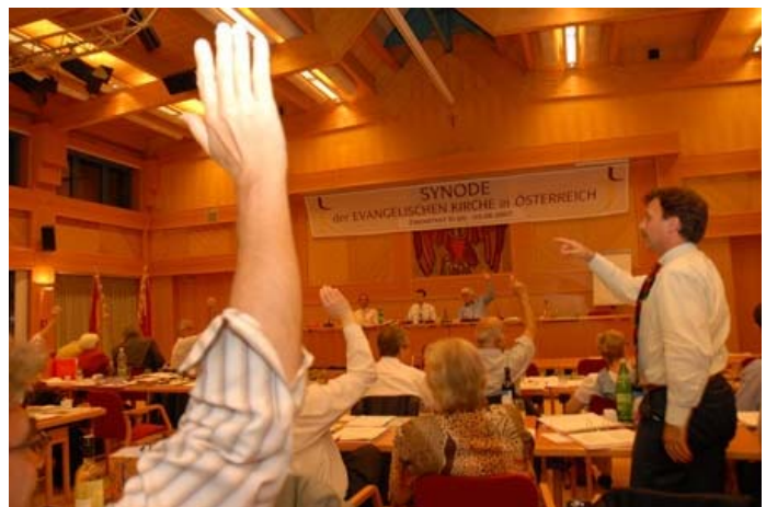
Az Ausztriai Evangélikus Egyház legfőbb törvényhozó testülete a zsinat (Generalsynode), amely évente egyszer ülésezik. E testület az egyház demokratikus életének letéteményese.

A két hitvallásos alapon álló egyház külön-külön egyházszervezetben és saját évente ülésező zsinatok, valamint évközben zsinati bizottságok által rendezi ügyeit. A lutheránus egyházfőtanács és a református egyházfőtanács a zsinatok megbízásából vezeti az egyházat. A lutheránus püspök az egyház teológiai felelőse. A személyi, az egyházak közti, az iskolai, az anyagi és a jogi kérdéseknek referensei a püspökkel együtt alkotják az Egyházfőtanácsot (Oberkirchenrat), amely többségi szavazattal dönt fontos kérdésekről. A református egyház nem ismeri teológiai okokból a püspöki hivatalt - kivéve a magyar nyelvű református egyházakat -, ezért egy országos szuperintendens (Landessuperintendent) az egyház teológiai vezetője. A kis református egyház zsinatának minden lelkész és a lelkészek számával arányosan nemlelkészi delegátus tagja.