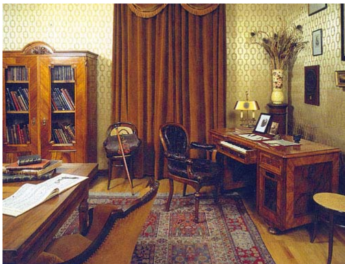
A budapesti Régi Zeneakadémia épületében található Liszt Ferenc Emlékmúzeum a zeneszerző utolsó pesti lakásának rekonstrukciója.

Hazafiságának felébredését tett követi, rögtön indul, hogy Bécsben és Pozsonyban több jótékonyági koncerteket adjon. Pestre 1840-ben jut el, ahol óriási ünneplésben van része – ez alkalom lelkesültségében írja Vörösmarty köszöntő versét, amire Liszt később a Hungária című szimfonikus költeményét komponálja meg válaszként. (A verset Kodály zenésítette meg vegyeskarra.)