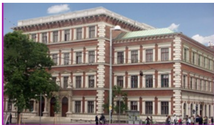
A Bécs központjában lévő evangélikus iskola 1861-ben épült. Azóta szolgálja az oktatás ügyét. A II. világháborúban az épület súlyosan megsérült, anyagi gondok miatt csak 1960-ban kerülhetett sor újjaépítésére.

felsőausztriai Gallneukirchenben és a karintiai Treffenben. Ezek az iparosodás által megnövekedett szociális nyomor enyhítésén is munkálkodtak. Kevés, de magas szintű evangélikus iskola létesült, így pl. a ma is fennálló iskola a bécsi Karlsplatz-on, részben a bécsi zsidók anyagi segítségével, akik gyermekeiket nem akarták katolikus iskolákba járatni.