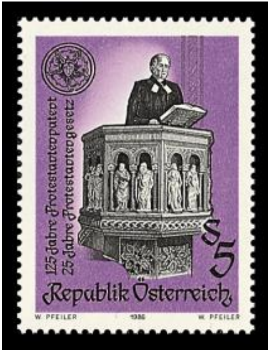
Az osztrák posta 1976-ban jubileumi bélyeget adott ki a protestáns pátenst 125. és a protestáns törvény 25. évfordulója alkalmából.

Nagy lendületet adott az 1882-ben kezdődött tömeges áttérés a katolikus egyházból az ún. „El-Rómától-Mozgalom” nyomán. Célja volt a római-katolikus egyház politikai és társadalmi befolyásának ellensúlyozása német-nemzeti előjellel. A katolikus szociálpolitika a munkásokat is elidegenítette. Már 1898 és 1900 között 10.000 katolikus hagyta el egyházát, majd ennek nyomán 1914-ig 65.000 lett az evangélikus egyház tagja. Ez a tömeges áttérés óriási kihívást jelentett, hiszen az új egyháztagek gyökértelenné váltak, mint politikai ellenzék váltak protestánsná. A habsburgellenes német-nemzeti érzületet különösen is a Gusztáv-Adolf-Egyesület ápolta, míg a Luther-Szövetség a politikai befolyást nem támogatta. Sok új gyülekezet alakult, amelyekben mai napig tapasztalható az egyházi gyökértelenség és a rejtett egyházellenesség.