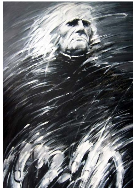
Kulinyi István: Liszt Ferenc (Home Galeria)

Zongorajátékának fejlesztése mellett – ami olykor szomszédjai panaszaiból is értesülve napi 10-12 órai gyakorlást is jelenthetett – ugyanevvel a mohó hévvel