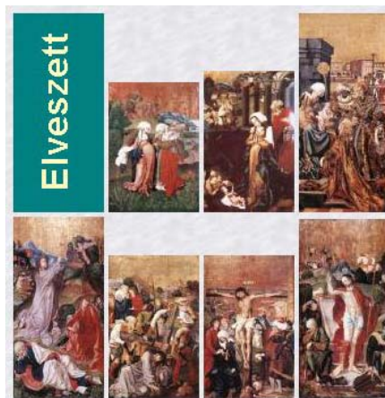
A selmebányai szárnyasoltár rekonstruált táblaképe