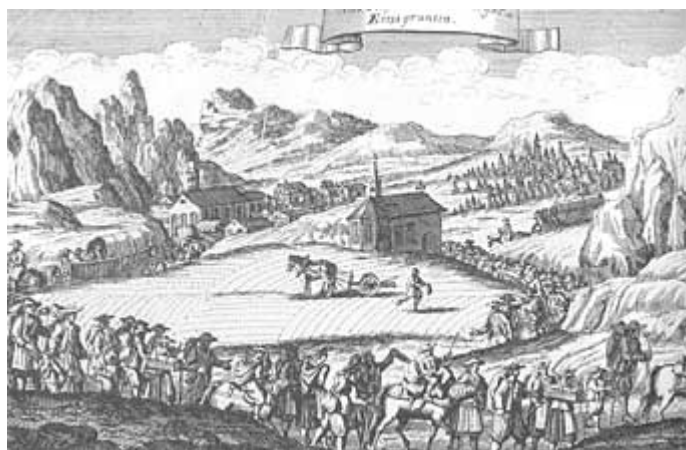
Salzburgi kivándorlók képei 1732-ből

Egységes reformációról és egységes ellenreformációról nem beszélhetünk, hiszen mindkettő váltakozó sikere ill. sikertelensége tartományoként más és más volt. Az ellenreformáció 1580-tól nagy erővel folytatta a rekatolizációt. Különösen a 30 éves háború, tehát 1648 után egyre eredményesebb is volt. Katonai segítséggel, sokszor éjszakai rajtaütéssel az ún. „vallásbizottság” (Religionskommission) üldözte a Biblia olvasását, házi áhitatok megtartását, a lutheri énekek éneklését és a Káté szerint történő oktatást. Halálos ítélettel, vagyonelkobzással, börtön- és pénzbüntetéssel súlytották a reformáció híveit. Tirolban leginkább az újrakeresztelőket érintette az üldözés. 1609-1610 között helyenként ismét felvirágzott a reformáció, de hanyatlását nem lehetett megakadályozni. 1600-tól kezdődően kb. 100.000-200.000 protestáns vándorolt ki. 1650 után Ausztria ismét többségben katolikus volt.