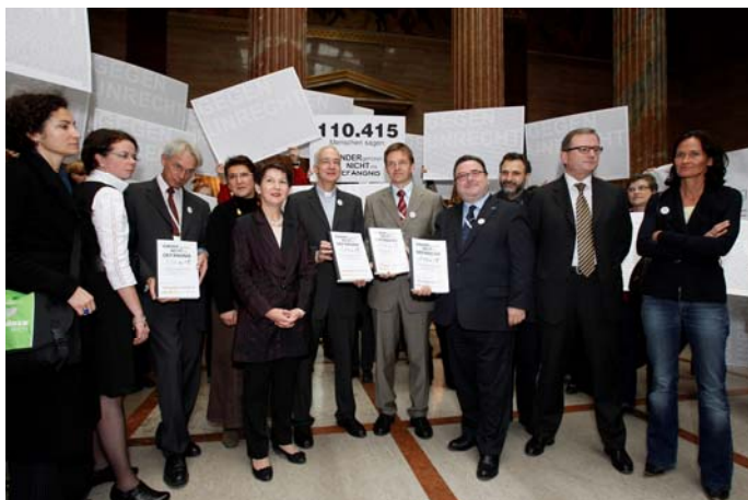
Egy akció a sok közül, amelynek során több segélyszervezettel együtt 2010 novemberében tiltakozó aláírásokat adtak át az osztrák parlament elnökének gyermekek Ausztriából való kiutasítása ellen.

A katolikus Caritasnak és az evangélikus Diakóniának ugyanaz az Úr a megbízója. Egymásnak testvére a két szervezet, így közel állnak egymáshoz, de a testvéreknek sem mindig könnyű egymással. Közös projektjeink leginkább ott vannak, ahol keresztény alapértékeket veszélyben látunk. Így együtt követeljük a kormánytól például a gyermekek jogának alkotmányban való rögzítését, hogy a társadalomba jól beintegrálódott családokat ne tudják kitoloncolni az országból vagy egymástól szétszakítani. Ugyanígy közös akcióink a „Nachbar in Not” (Szomszéd a bajban) vagy a „Licht ins Dunkel” (Fény a sötétségben). Különösen e két kezdeményezés mutatja, hogy fontos más szervezetekkel pl. a Vöröskereszttel való együttműködés is, ha nagyszabású akciókat veszünk a vállunkra.