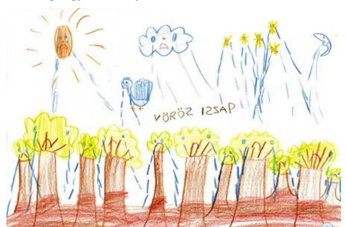
Gyermekrajz a katasztrófáról

Sötét este volt mire a délelőtti műszakból hazaértem. Kerülőnek mentünk és nem igazán láttam semmit és talán nem is éreztem volna. Egyfajta zsibbadt mélabú telepedett rám. A Jó Isten a családomat megkímélte, a házunktól 50-100 méterre állt meg a gyilkos folyam.