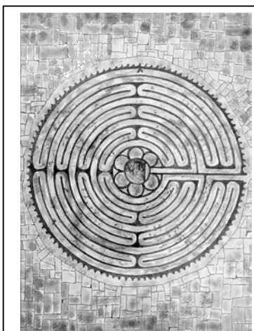
A Chartes-i katedrális padlójának labirintusa. (Franciaország, 12.sz.)

Ezt mondja az ÚR, a te Megváltód, Izráel Szentje: Én, az ÚR, vagyok a te Istened, arra tanítalak, ami javadra válik, azon az úton vezetlek, amelyen járnod kell. (Ézs 48,17)