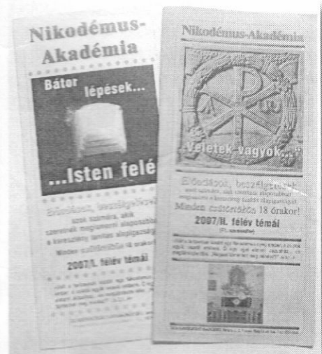
Nikodémus-Akadémiára hivatató szórólapok I-II. félév Vigyük, nézzessük és hívjuk fel mások figyelmét is!