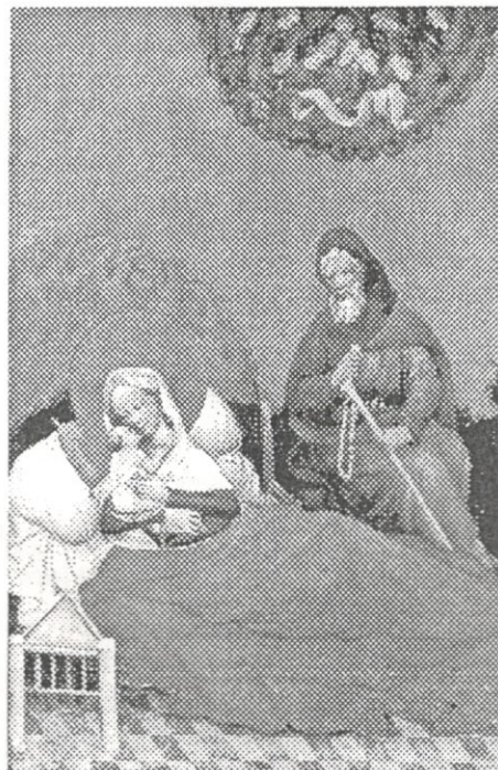
Szent Család. Részlet az 1320-ból származó Mária szárnyasoltár bal oldaláról. (Evangélikus Szent Mária templom – Dortmund.)