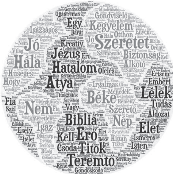
2. ábra: A hitoktatók asszociációinak szófelhője

A hitoktatók mintája ebben a vizsgálatban rendkívül kicsiny (9 fő), ennek ellenére a vizuális összehasonlítás kedvéért megmutatom az ő asszociációikból képzett szófelhőt is, ez alapján jól látható egyezések is vannak a középiskolás mintával. Az oktatók majdnem fele asszociálta a szerelem és erő szavakat, egyharmaduk pedig a teremtő és a béke szót. A hitoktatókról elmondható, hogy rengeteg egyedi szót és kifejezést is asszociáltak, amelyek sehol máshol nem fordulnak elő a mintában. Ez nem is meglepő, hiszen teológiai végzettségű, saját istenfogalmukra folyamatosan reflektáló, annak elemeit bővítő személyekről van szó. Az ő istenfogalmuk színezete ennél fogva jóval kreatívabb, individuálisabb jelleget kap.