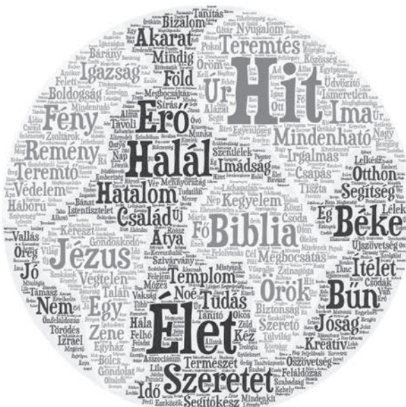
1. ábra: A középiskolások asszociációinak szófelhője

A középiskolások által asszociált szavakból szófelhőt készítettem a WordArt ingyenes online szófelhőkészítő szoftver 4 segítségével, így jól vizualizálható, hogy ebben a mintában mely szavak alkotják a fogalom szociális reprezentációjának tartalmát.