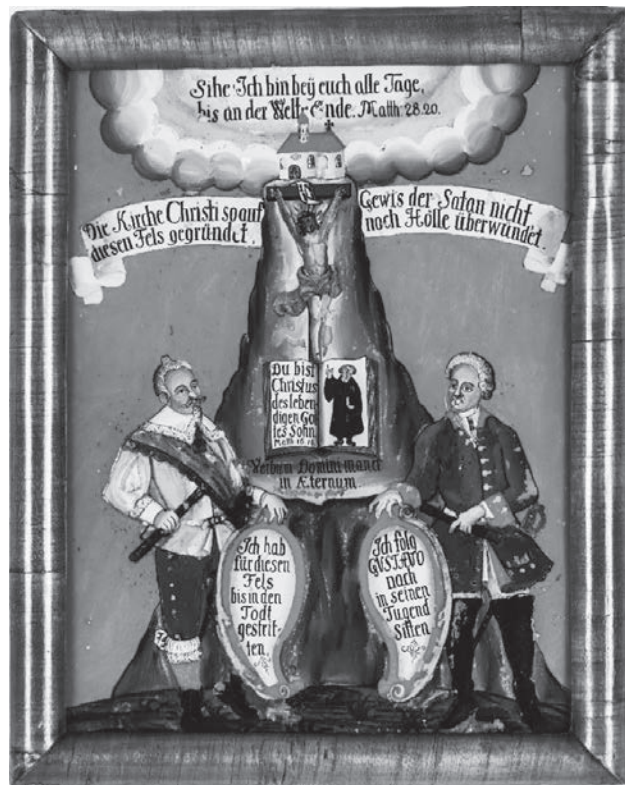
A hit szikljája . Fordított üvegfestmény, 1740–1790, Stadtmuseum Kaufbeuren (leltári szám: 190)

A festmény egyszerre emlékeztet és érvel. Egyszerre szolgál a hit alapvető tételeinek továbbadására, megerősítésére, valamint igazolására. Úgy jelenik meg, mondanivalóját úgy ábrázolja, mint a vizuális propaganda eszköze, mely hozzásegíti a szemlélőt, hogy megismerje és rögzítse az evangélikus egyház többi felekezettől elkülönülő jelleget. Egyfajta „memóriaképként” ( Merkbild ) vagy igazolásként szolgáló, megerősítő képként ( Rechtfertigungsbild ) mutatkozik meg, amelyen nagy szerepet játszanak az ábrázolt történelmi alakok. A világháborúkat megelőzően Európában a legnagyobb emberáldozattal járó háború, a harmincéves háború (1618–1648) borzalmait után nagy szerepet kapnak a képeken az evangélikus hit harcos védelmezői, akik, ha kell, életüket is áldozták az igazság támogatásáért. Ilyen oltalmazóként tűnik fel képünkön Gusztáv Adolf svéd király (uralkodott: 1611–1632), aki sikeres hadjáratokkal támogatta az evangélikusságot. Személye és harcias kiállása emblematikussá tette alakját, és előszeretettel ábrázolták őt akár Luther Márton és Melanchthon Fülöp társaságában is, annak ellenére, hogy nem egy időben éltek.