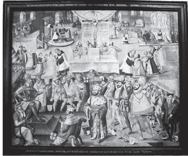
Andreas Herrneisen: Az Ágostai hitvallás átadása. Kasendorf, 1602

tetve az azt felvállaló urakat és fejedelmeket, de a jelenet fölött jobbra és balra megjelennek az evangélikusok által legfontosabbnak tartott tételek is.