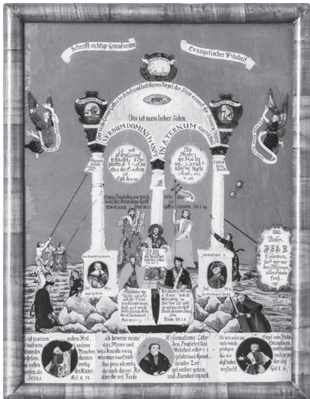
Grundvesten evangelischer Wahrheit , 1740–1788, Stadtmuseum Kaufbeuren (leltári szám: 187)

A reformáció elterjedését követően, a konfesszionalizálódás időszakában a kereszténységen belüli megosztottság megjelenésével az érintettek egyre nagyobb hangsúlyt fektettek a saját hitvallásuk, szervezeti felépítésük sarokpontjainak bemutatására, népszerűsítésére. Az Ágostai hitvallás átadása történeti eseményének, jelentőségének hangsúlyozása helyett az ekkor született ábrázolások inkább krisztológiai szempontból mutatták be az evangélikus egyház szerepét. Krisztus üdvözítő szerepe került a középpontba, és ehhez kapcsolódtak a megreformált egyház helyesnek tartott cselekedeteit bemutató, magyarázó képek. A felekezetek közötti konfliktusra utalnak a képen megjelenő katolikus figurák, akik az építmény alapjait akarják szét-hordani vagy az oszlopait kidönteni. Ennek a képtípusnak is több változata létezik. Egyik érdekes példája a kaufbeureni múzeum gyűjteményébe tartozó fordított üvegfestmény az „evangélikus igazságról” ( Grundvesten Evangelischer Wahrheit ). A fordított üvegfestés (reverse glass, vagy a bajoroknál hinterglas ) technikája a középkorban jelent meg először Európában, főként bizánci hatásra. Elsőként Itáliában, majd később az egész kontinensen ismertté vált. Az üveglap hátoldalán, általában enyves vagy tojásos, ritkábban olajos kötőanyagú fedőfestéssel, fordított sorrendben (a befejező vonásoktól a háttér, illetve alap felé haladva) készült. Magyarországon több helyen, de leginkább a Pálóc-földön előszeretettel használták ezt a technikát a 18. század végétől.