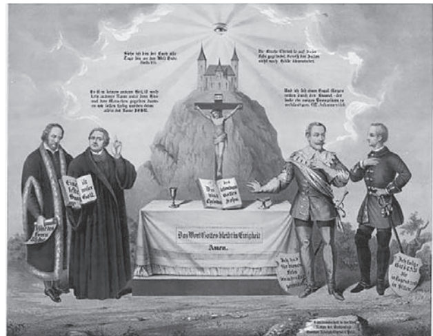
Az egyház sziklája.

A képek érdekessége, hogy a Gusztáv Adolf személye mellett megjelenő nemesember alakja csak ritkán azonosítható be a felirat alapján mint konkrét történelmi szereplő (XII. Károly svéd király [1697–1718] vagy Szász-weimari Bernát [1604–1639], esetleg I. Hesseni Frigyes [1676–1751]). Több képen, név vagy konkrét megnevezés nélkül, mint a nagy király példáját követő helyi vezető/főúr, pontosan be nem azonosított, akár szabadon behelyettesíthető, odagondolható személy is lehet (mintha azt sugallaná a kép, hogy bárkiből lehet a hit bátor védelmezője). A képek közötti hasonlóság egyértelmű előképre vagy mintára vezethető vissza; sokszorosított nyomatok formájában már a 18. század elején elterjedtek. Számos változatuk jól mutatja a típus népszerűségét. A képtípus továbbélésére például szolgálnak a 19. század folyamán született, hasonló felfogásban készült nyomatok és sokszorosított grafikák.