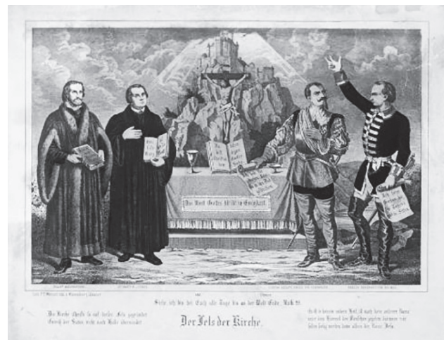
Az egyház sziklája. Badisches Landesmuseum Karlsruhe, ~1860 (leltári szám: 80/409-188)