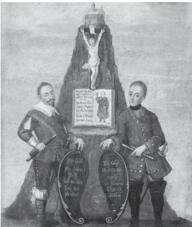
A hit sziklája. Olajkép, 17–18. sz., Salzburg, Dorotheum aukciósház, 2017

A képek érdekessége, hogy a Gusztáv Adolf személye mellett megjelenő nemesember alakja csak ritkán azonosítható be a felirat alapján mint konkrét történelmi szereplő (XII. Károly svéd király [1697–1718] vagy Szász-weimari Bernát [1604–1639], esetleg I. Hesseni Frigyes [1676–1751]). Több képen, név vagy konkrét megnevezés nélkül, mint a nagy király példáját követő helyi vezető/főúr, pontosan be nem azonosított, akár szabadon behelyettesíthető, odagondolható személy is lehet (mintha azt sugallaná a kép, hogy bárkiből lehet a hit bátor védelmezője). A képek közötti hasonlóság egyértelmű előképre vagy mintára vezethető vissza; sokszorosított nyomatok formájában már a 18. század elején elterjedtek. Számos változatuk jól mutatja a típus népszerűségét. A képtípus továbbélésére például szolgálnak a 19. század folyamán született, hasonló felfogásban készült nyomatok és sokszorosított grafikák.