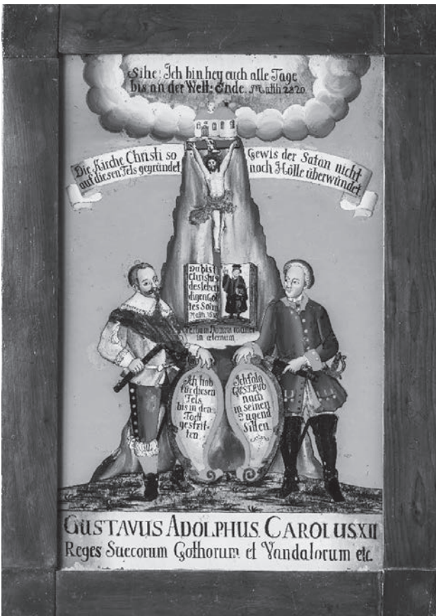
A hit sziklája. Fordított üvegfestmény, 1740–1790, Stadtmuseum Kaufbeuren (leltári szám: 5072)