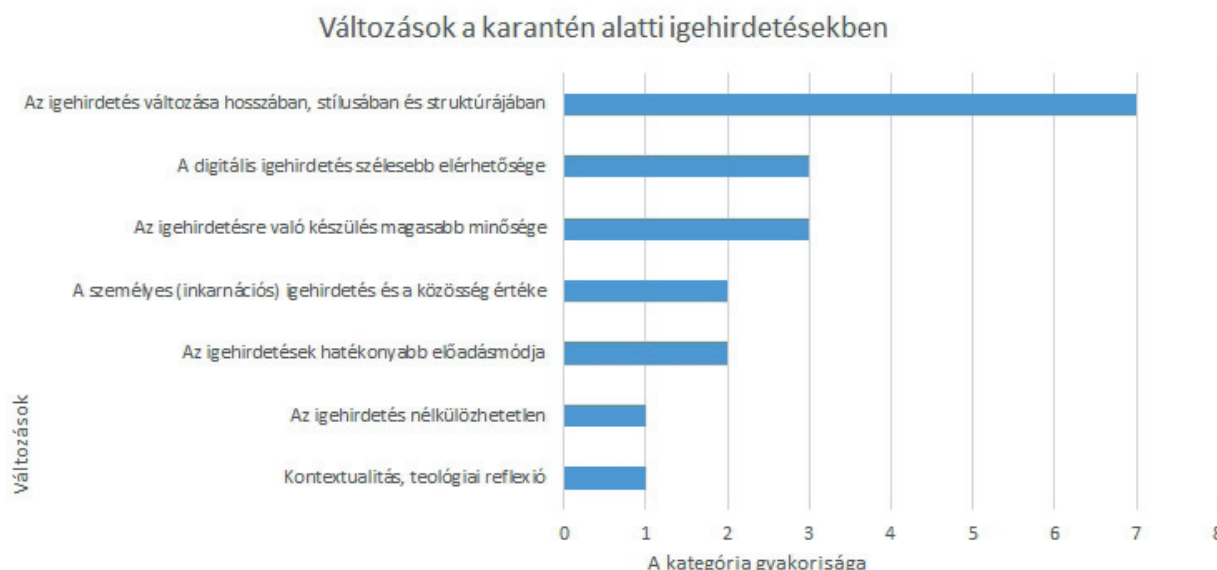
3. diagram. Változások a karantén alatti igehirdetésekből

netének hirdetését, és segítheti az igehirdetőt abban, hogy még nagyobb érzékenységgel és megértéssel forduljon azok felé, akiknek az evangélium üzenetét hirdeti. Az igehirdetés nem választható el az igehirdető személyétől, így a személyes hitreflexió is fontos eszköz az igehirdető vándorútján, amelyet szükséges hogy támogasson az önreflexió és a személyes jóllét biztosítása (SANCKEN 2020).