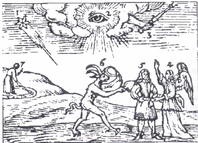
Az angyal és az ördög vetélkedése az ember lelkéért. Fametszetes példabeszéd illusztráció, 17. sz.