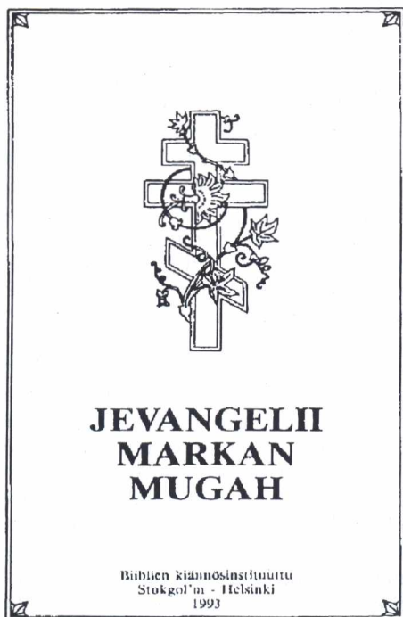
Márk evangéliuma karjalai nyelven

A minden élő tisztelete, a természet egyensúlyának megőrzésére való törekvés csodálatot ébreszt a hantik konyságra épülő, ún. civilizált világból érkező vendégekben. Amikor az egyik vadász csónakkészítés szándékával kidöntött egy cirbolyafenyőt, rögtön el is kezdte kiféragni, nehogy a fa azt higgye, hogy hiába döntötték ki mert akkor szomorú lesz. Ha viszont már látszik, hogy csónak lesz belőle, akkor a fa örül, hogy további életében az embert szolgálhatja. Elképzelhetjük, mit érezhetnek az őslakosok, amikor földjükön a kőolajipar nevében értelmetlenül pusztítják az erdőt. A több ezer hektáros tarvágások, az erdőtüzek, a vadak és a halak pusztulása az emberi lelkekre is pusztító hatással van. Az évszázadokon keresztül biztosnak hitt értékek válsága és kilátástalanság a hantik többségét az alkoholizmushoz sodorta. De nemcsak ők, hanem a területen élő ipari munkások, akik a volt Szovjetunió minden sarkára sereglettek ide a magas fizetés reményében, szintén embertelen körülmények között tengetik életüket. Minden napos a bűnözés. Ez a világ is megérett a megváltásra. szél pedig fú. Szurgutban, a korábbi szocialista iparosban most egyszerre három templom épül: ortodox, baptista és muzulmán mecset. A hanti sámán unokája tavaly beiratkozott a tobolszki papi szemináriumba. Anna Nyerkagi nyenyec író nő pedig legújabb regényét egy vallomással kezdte: „A Mennyei Atya rám talált. Amikor én személyes életem véget ért, új élet kezdődött, amikor nek minden percével ezután Ő rendelkezik