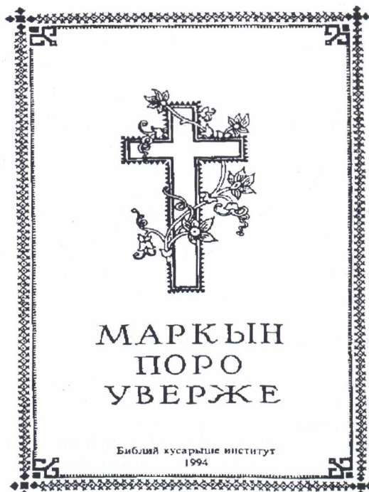
Márk evangéliuma cseremisz (mari) nyelven