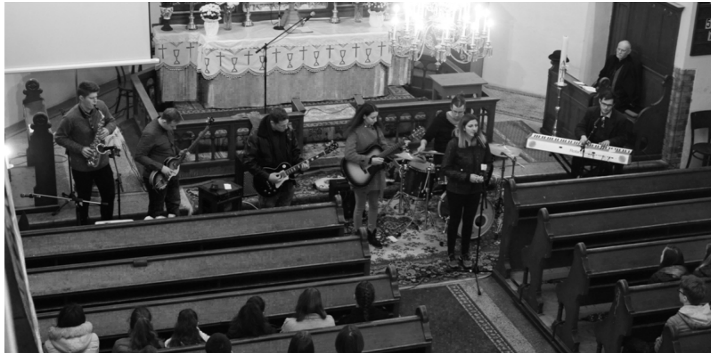
Zahorecz Pál Oros Café

„a zene csodáját és Jézus Krisztus mivoltának egy kis szeletét sikerült elvinnünk Békés megyébe”