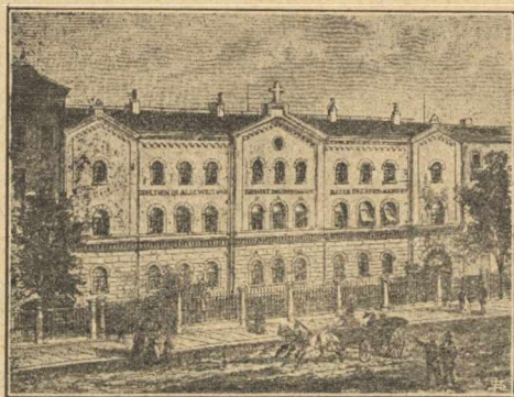
A lipcsei misszióház.

„A drezdai evangélikus lutheránus misszió az egyetemes lutheránus egyházhoz! Nyílt magyarázat és sürgős intés. Előre vagy hátra?“ című iratában. Ezen nyílt és őszinte irat örvendetes visszhangra talált; a lutheránus egyesületek minden oldalról a drezdaihoz csatlakoztak s az adományok 1843-ban 2.000, 1845-ben 14.000, 1847-ben 17.000 tallérra emelkedtek. Ezen örvendetes növekedés folytán Graul arra a meggyőződésre jutott, hogy a drezdai egyesület vezérszerepet tovább nem vihet. E mellett mindinkább felismerte annak szükségét, hogy a távozó hittérítőket minél alaposabb tudományos képesítésben kell részesíteni s e két ok indította őt arra, hogy a misszió intézetnek Drezdából Lipcsébe való áthelyezését indítványba hozza. Mindkét már 1846-ban benyújtott indítványát az 1847-iki közgyűlés, melyen a legtöbb lutheránus országos egyház képviseltette magát, a szászországi misszióbarátok áldozatkész önzetlensége folytán majdnem egyhangulag elfogadta.