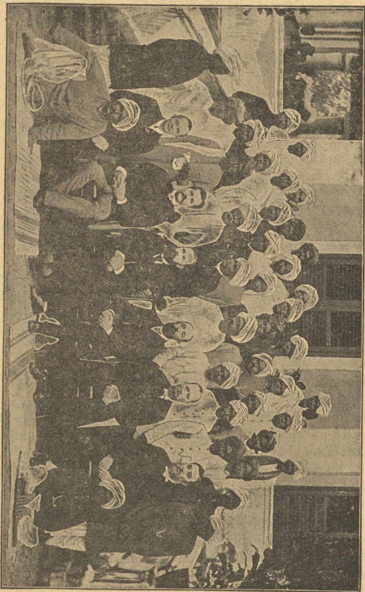
16 benszültött lelkész s 21 preszhyter.

Anukrâchâm még 1901 végeig a képezdében marad s 1902 elején teszi le utolsó vizsgáját az egyháztanács előtt, mire ugynevezett primary-iskoláink egyikében fogjuk alkalmazni. Ha itt beválik, ugy nem lehetetlen, hogy később valamikor egy katechéta tanfolyamra is behívjuk, ami azonban attól függ, hogy miként fog a gyakorlati feladatnak meg-