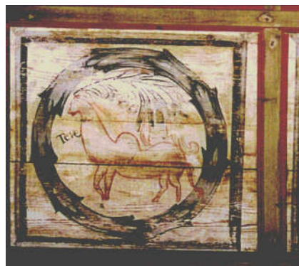
Festett famennyezet, református templom, Kraszna, Pataki Asztalos János munkája 1778-ból.

I. Kérdés: Micsoda dolgoknak lehet példázója a Teve, és micsoda tanulságaink származhatnak belőle?