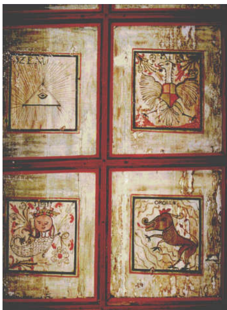
Festett famennyezet, ref. templom, Szilágylompért, ismeretlen festő munkája 1778-ból.