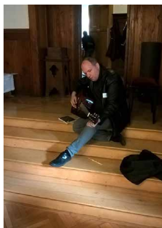
Szombat reggeli bemelegítő ének