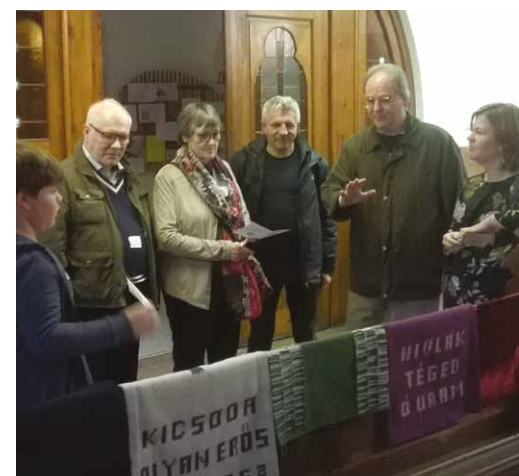
A szombat délelőtti vetélkedőn