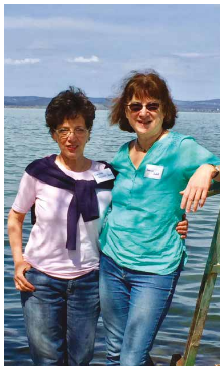
Itt kezdődött az érdemi munka

- Van-e már valami visszhangja a könyvnek?