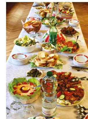
A terített asztal