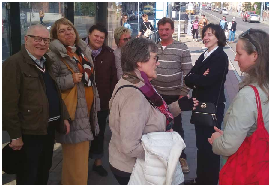
Városnézés a vendégeinkkel