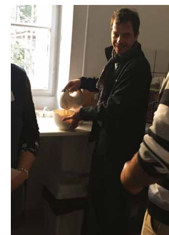
Közös főzés szombaton