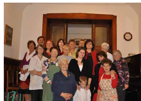
A háziasszonyok vasárnap reggel