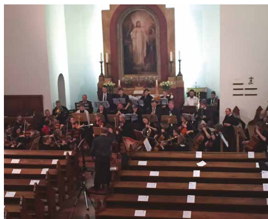
A szombati koncert