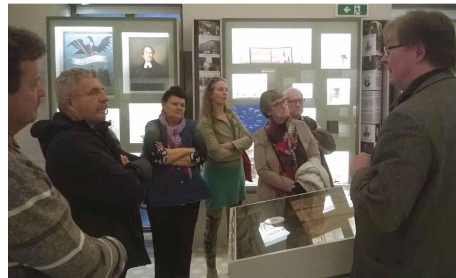
Látogatás az evangélikus múzeumban