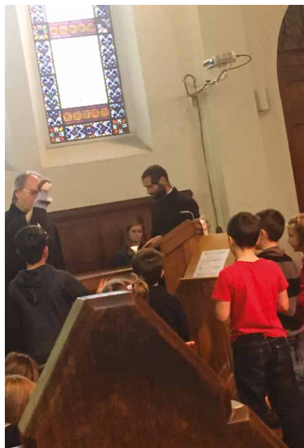
Ha tanít Benedek