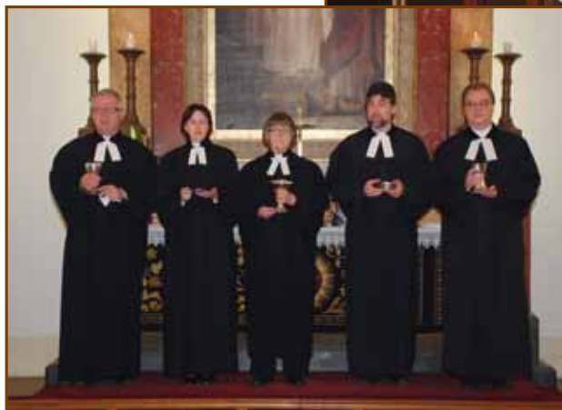
Közös szolgálat a finn lelkészekkel