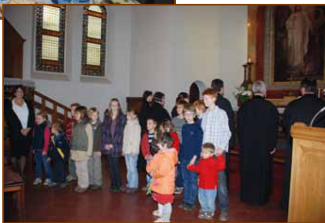
Gyerekek ünnepi éneke