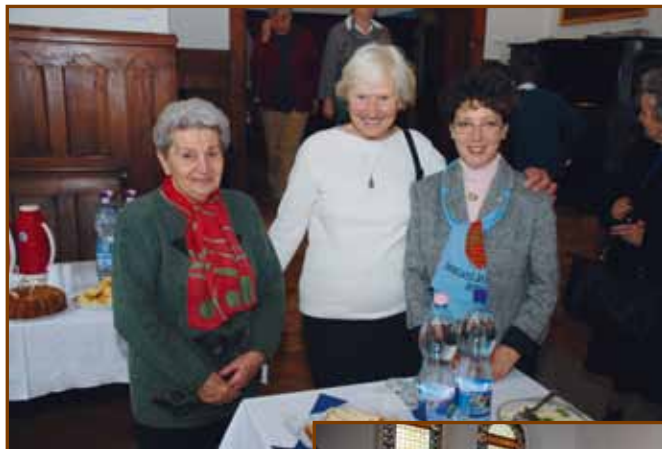
Az ünnep háziasszonyai