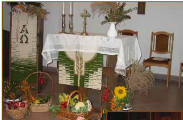
A betakarítási hálaadó istentisztelet oltára Farkasréten