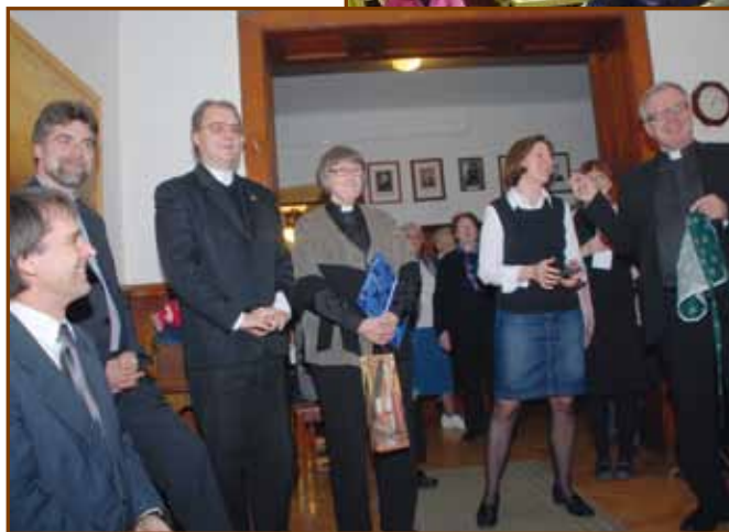
Ajándékozás a finn testvérekkel