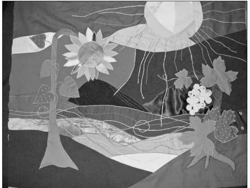
A balatonboglári zöld oltárterítő

hogy milyen sokan jöttünk össze, hogy a mai alkalomra együtt készüljünk elő. Rendeztük a kertet, díszítettük a templomot, pakoltuk a termet jó kedvvel, nagy beszélgetésekkel. A gyerekek ugyan kikotyogták, de nekem így is nagy meglepetés az énekkar szolgálata. És nemsokára