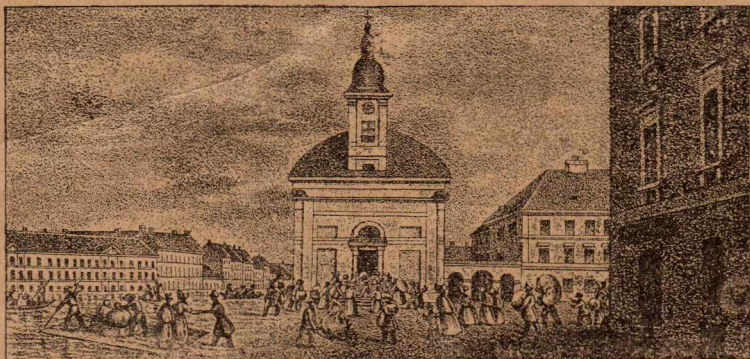
Templomunk a nagy árvíz idején, 1838-ban.