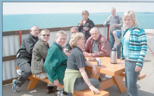
A NOREA munkatársai

dió és televízió olyan embereket is meg tud szólítani, akikhez a hagyományos misszionáriusok nem jutnak el. A mondas úgy tartja, hogy aki a világot akarja megszólítani az evangéliummal, annak rádióra van szüksége. Ma azonban – átfogalmazva az eredeti mondatot – inkább médiáról kell beszélnünk, mert nem hagyhatjuk figyelmen kívül a tévét és az Internetet sem. A rendelkezésre álló eszközöket úgy kell használni, hogy akiket elér az evangélium, azok üdvösségre jussanak, növekedjenek a keresztény hitben, és kövessék Jézus Krisztust.