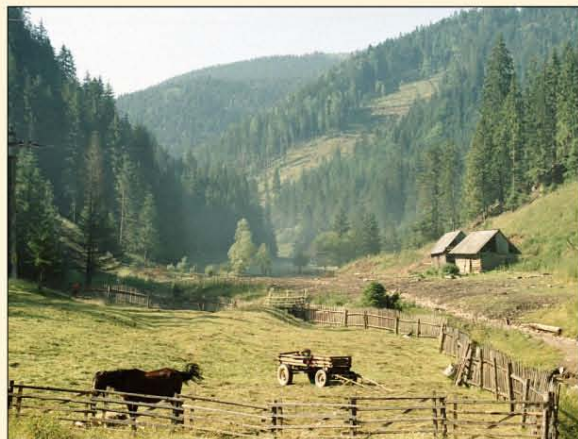
„Völgy vándorát a hegyek csókja várja.” (Wass Albert)