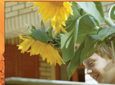
„Olyan örömet kaptam Tőled Istenem.”