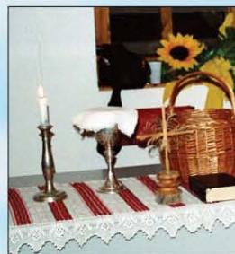
Úrvacsora punyával (cigányok kenyeré)

Roma-magyar konferencia Sárszentlőrincen