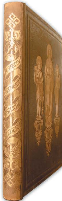
Luther Márton énekeinek gyűjteménye

Luther teljesen nyitott volt nemcsak a gyülekezeti és papi ének dolgában, hanem a többszólamú művészi kórus felé is. A Babst-féle énekeskönyv előszavában kifejtette, hogy a keresztyén ember tele van az evangélium feletti