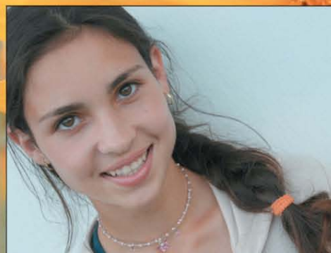
„Jézus szemembe néz! Mi az, mi benned él?”