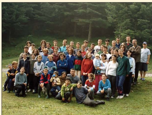
Ifjúsági konferencia Lupény mellett, a hegyekben