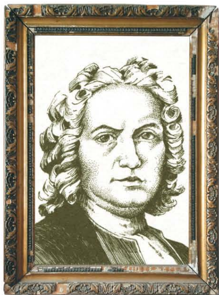
Johann Sebastian Bach

Jelen válogatás a XV–XVIII. századig terjedő időszak legjelentősebb evangélikus zeneszerzőit tartalmazza