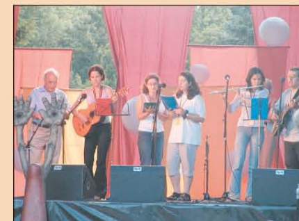
Szélrózsa – Kismaros

A HÍD EVANGÉLIKUS MAGAZIN előfizetése egy évre 1200 Ft. Megrendelhető írásban név és cím beküldésével az Evangélikus Missziói Központ címén: 1656 Budapest, Pf. 22. Adományokat az Evangélikus Missziói Központ számlaszámára lehet küldeni: 11716008 - 20157087.