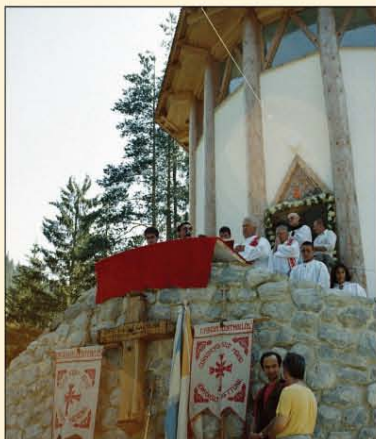
Szent Kristóf napja a Gyilkos-tónál