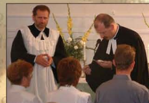
Istentisztelet a szlovák gyülekezetben

Talán ezért is vagyunk valahányan szkeptikusak bármilyen új láttán, főleg ha szerintünk reménytelennek is tűnik az egész. Budapesti Szlovák gyülekezet – már a név is kicsit elrettentőnek tűnik a mai politikai és társadalmi közhangulatot ismerve. Innen, Magyarországról Trianon sebeit nyalogatva, irigykedve és igazságérzetünk teljes tudatában értékeljük a szlovák államiság létjogosultságát. Onnan, Szlovákiából pedig a jogos önrendelkezés és nemzeti függetlenség jegyében nem értik a határon túli indulatokat.