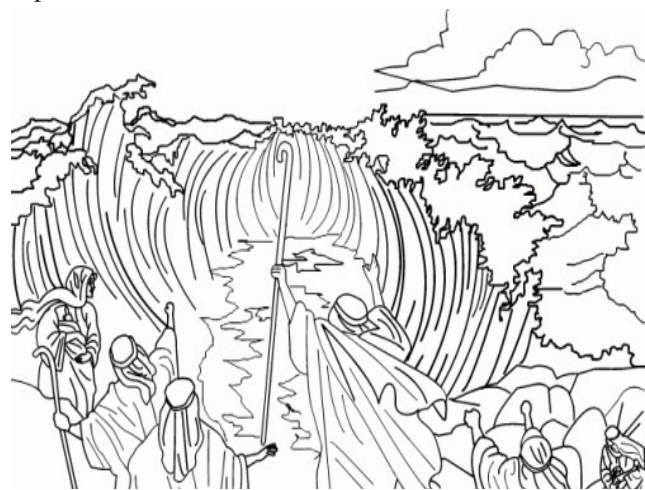
Jézus lecsendesíti a tengert

Szükségünk van elkötelezett emberekre és családokra! Mégis, a gyülekezet-építéssel foglalkozó elméleti és gyakorlati munkák egytől egyig emlékeztetnek a zsoltairos szavára: „Ha az Úr nem építi a házat, hiába fáradoznak az építők!” (Zsolt 127.) Ezért a gyülekezet legfontosabb szolgálata az imádság. Mert mégsem a motor, hanem a vitorlát fújó Szentlélek hajtja a hajót. Adni csak az tud, aki maga is kapott.