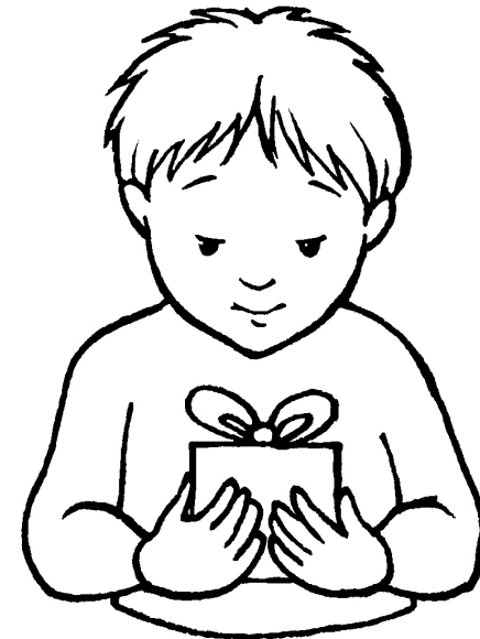
Fenyő Ágnes rajza

3 %o[ed [õŠ el ò S el òfäd el Wf f Wf VVWf], %Mk ]f l öff Ue1 VVWf e XX 'SVSf1 S_ Vk Wk el W ékl UeSsf hSYk el WWWW