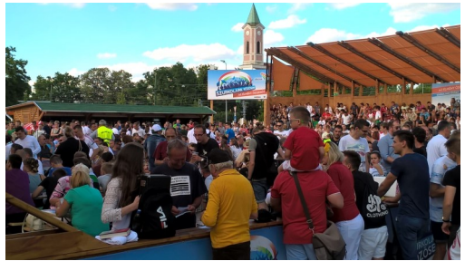
Die Fan-Arena in Csepel – in Sichtweite die katholische Kirche

Siege hingegen werden am liebsten in einem der vielen neu gebauten Stadien des Landes gefeiert. Beziehungsweise in „Fan-Zonen“, die entweder temporär und anlassbezogen organisiert – oder am besten gleich als feste Struktur aus dem pannonischen Boden gestampft werden. Beispiel: Anlässlich der Fußball-EM vor fünf Jahren in Frankreich ließ die Verwaltung des XXI. Budapester Stadtbezirks (Csepel) eine veritable Arena für das Public Viewing bauen. Alles aus Holz mit Bühne, Technik und viel Platz für die (hoffentlich jubelnden) Fans. Geld spielt in derlei Angelegenheiten keine Rolle, obwohl das Schmuckstück im Zentrum meines Bezirks so permanent wie meist vergeblich auf Nutzer harrt.