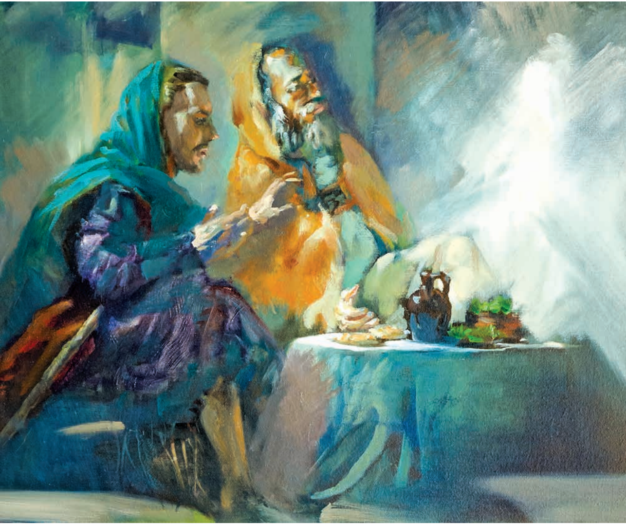
Lajta Gábor: Tanulmány Az emmausi vacsorához („ő azonban eltűnt előlük”), 2014–15, olaj, vászon, 45 × 55 cm