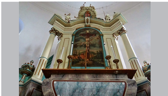
A mekényesi templom szószékoltára. Az oltárkép Gottlieb Solbrig alkotása 1785-ből.

Apáti (ma Bátaapáti), 1735: Bikács. 1740 körül: Kéty, Murga, 1765k: Alsónána. Baranyában: 1724: Tótfű, Hidas, 1735: Mekényes, Zsibrik (1748).