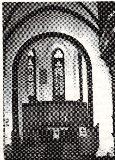
A Bernkastel-Kues-i evangélikus templom belülről.

A rövid ideig tartó, de tartalmas találkozás alatt több ötlet is felvetődött a testvéri kapcsolat kialakítására, s későbbi erősítésére. Az Úristen áldja meg mindkét Gyülekezetet, hogy minél több áldás legyen ezen a kapcsolaton.