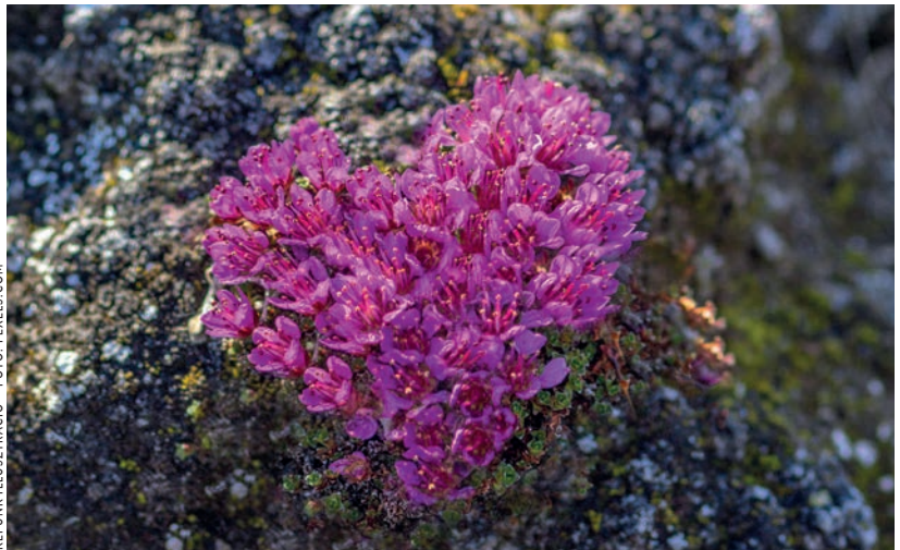
KÉPUNK ILLUSZTRÁCIÓ

A próféta meglátta, hogy a gazdasági fellendülésre semmi remény. Az Úrtól való eltávolodás csak a rosszat hozza, a háborút, a szétszórátást, a szenvedést. Felismerte, hogy a lélek megújulásának útját kell meghirdetnie. Majd az fog fellendülést hozni a továbbiakban. Hatalmas volt ez a feladat! De a nép megmaradásának egyetlen esélye volt ez: a lélekben történő újjászületés, a visszatérés az Úrhoz.