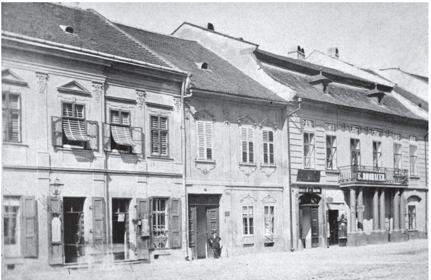
Eperjes főutcája, középen az evangélikus parókia épülete

És minden hallgat, és minden figyel, És minden a legforróbb érzelem... A kősziklák, e vén kritikusok, Maradnak csak kopáran, hidegen. (Eperjes, 1845. április)