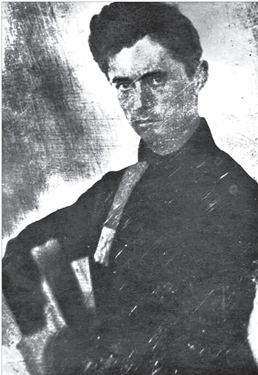
A Petőfiről fennmaradt egyetlen dagerrotípiáról készítette Escher Károly a retusált reprodukciót, amelyen a költő az eredeti képhez képest tükrözve látható

De térjünk vissza a kultusz kialakulásának kezdeteihez: ez pedig „az a pillanat, amelyben tudatosították eltűnését”. Szinte példátlan – mutat rá Margócsy István dolgozata –, hogy legfontosabb életrajzi adatai bizonytalanok egy ennyire a nyilvánosság előtt élt modern