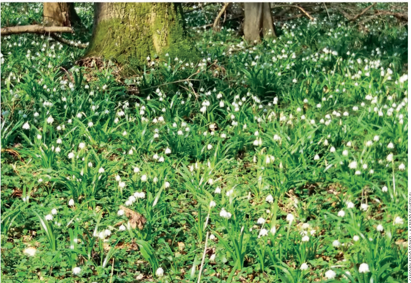
A CSAFORDI ERDŐ TÖZIKÉI