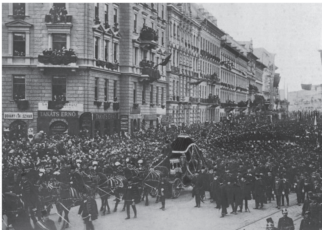
Kossuth Lajos temetési menete a gyászhintóval Budapesten, az Erzsébet körúton, a Dohány utcánál 1894. április 1-jén

Megemlékezésem végén a püspök zárógondolatát idézem: „Szeretteim az Úrban! Mély, boldogító jelentősége van Krisztus dicsőséges feltámadásának. Ő megtörte, megroppantotta a halál fullánkját. Ha valaki hisz Őbenne, az a halál