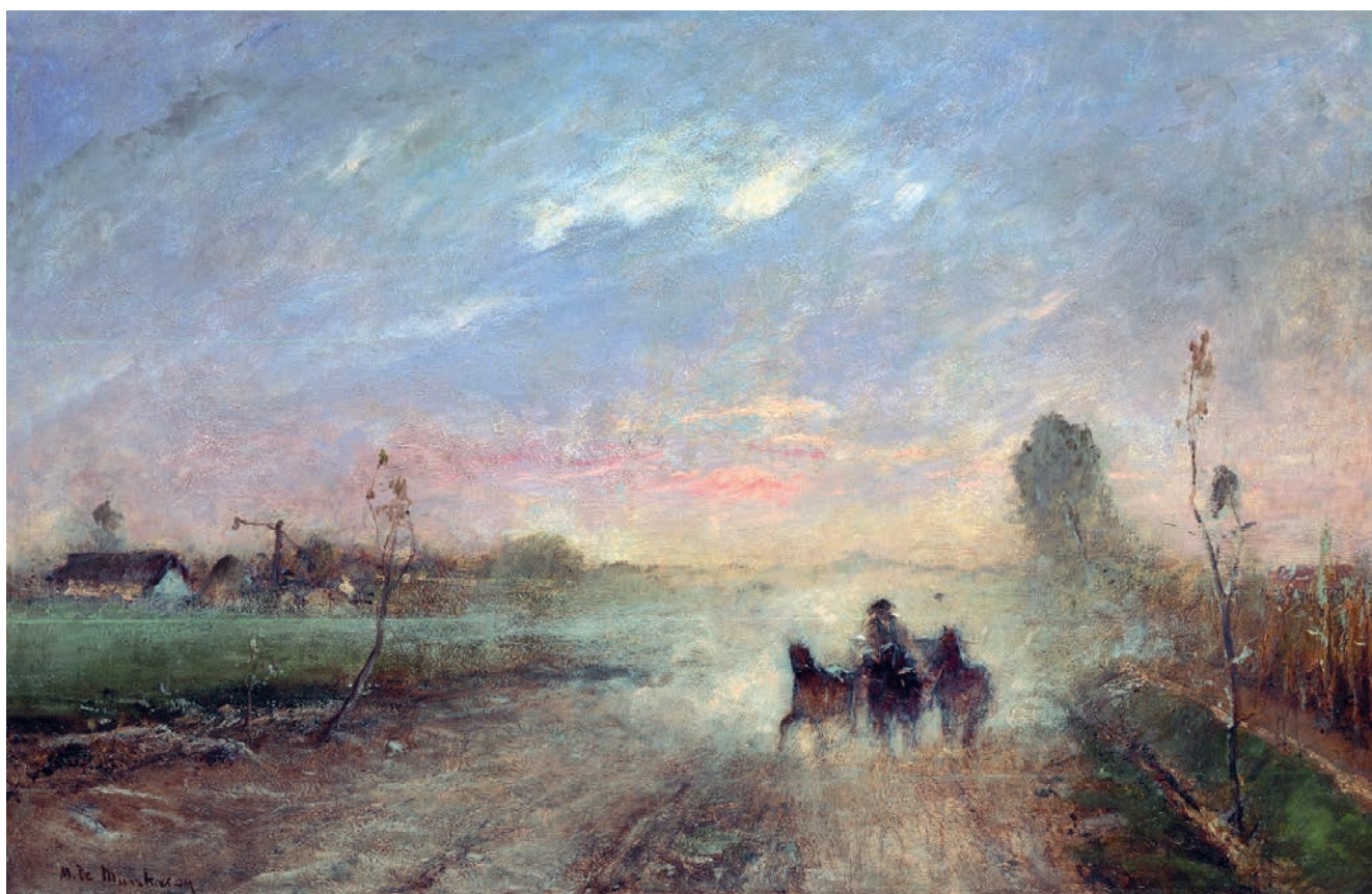
Munkácsy Mihály: Poros út I. (1874)

Petőfi bonyolult, vonzó, izgalmas személyiség. Talentumát hamar felismerte, és sokszorosán kamatoztatta: verseinek számát közel ezerre teszik. Életében korán történt minden, hiszen alig kapott időt. Napjainkban egy huszonöt éves ifjú talán még a szülői házban – a „mamahotelben” – él, vagy egyetemistaként javában keresi, mi is lehetne az élethi-