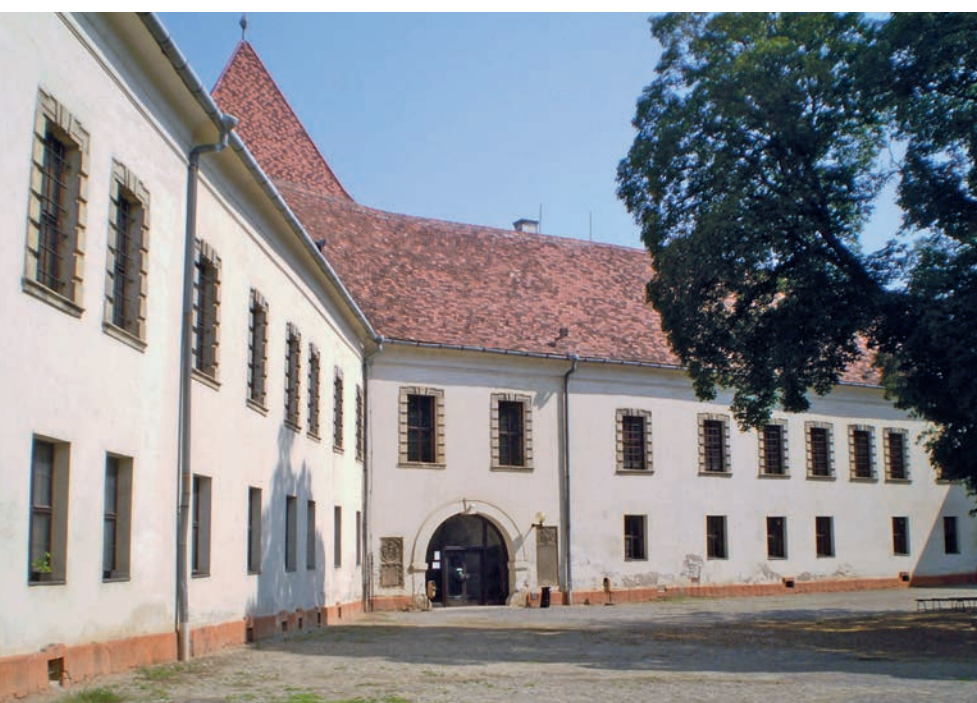
A sárosvári Nádasdy-vár

A szerző történész, a Fraknoi Vilmos Római Történelmi Kutatócsoport (Eötvös Loránd Kutatási Hálózat – Pázmány Péter Katolikus Egyetem – Pécsi Tudományegyetem), valamint a Magyarországi Kutató Intézet Történelmi Kutatóközpont tudományos munkatársa.