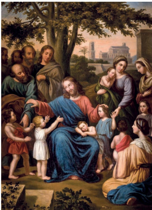
ISMERETLEN FRANCIA FÉSTŐ: ENGEDIÉTEK HOZZÁM JÖNNI A GYERMEKEKET (19. SZÁZAD)

A mimészis, a követés, az utánzás alapja nem más, mint a krisztusi szeretet és az ezzel szorosan összekapcsolódó megbocsátás képessége. Ahogyan a 4. fejezet utolsó versében olvassuk: „ Viszont legyetek egymáshoz jóságosak, irgalmasak, bocsássatok meg egymásnak, ahogyan Isten is megbocsátott nektek a Krisztusban. ”