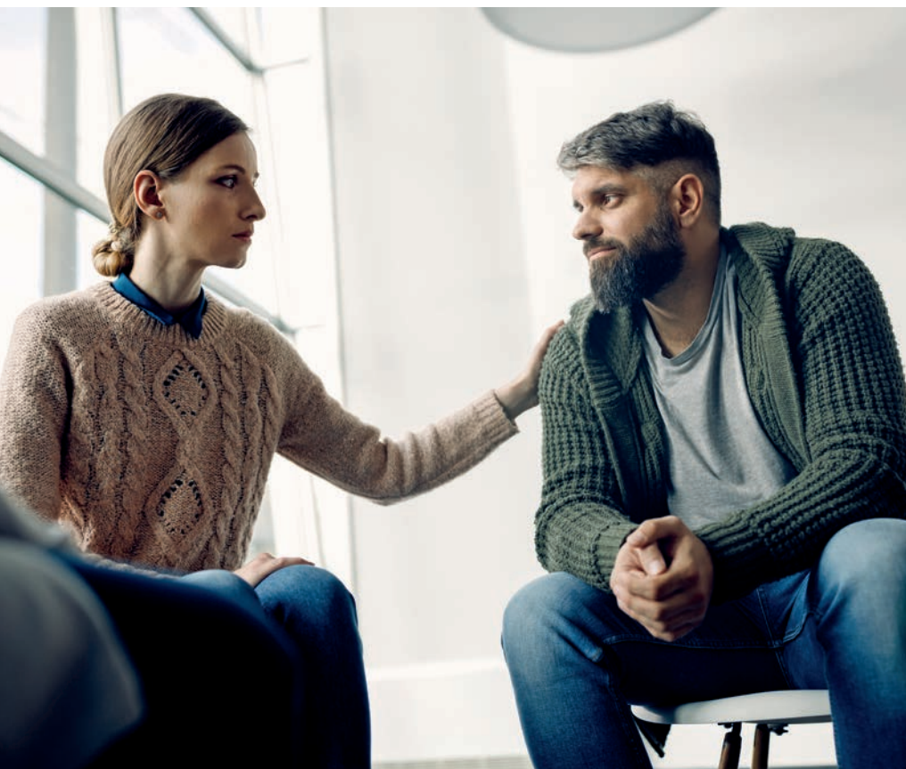
KÉPUNK ILLUSZTRÁCIÓ - FOTÓ: FREEPK.COM

az illető. És brillírozva sorolta is: a lovász elpatkol, a kertész fűbe harap, az üvegfüvő kileheli a lelkét, a portás beadja a kulcsot, a cipész feldobja a bocskort. A szöveg különben tényleg érdekes volt, de az özvegy azért – talán mondanom sem kell – nem vidult fel tőle. És mivel ilyen közegben hangzott el ez a poén, tapintatlan tréfának tűnt az egész. Pedig különben – egy átlagos napon még tetszett volna is.