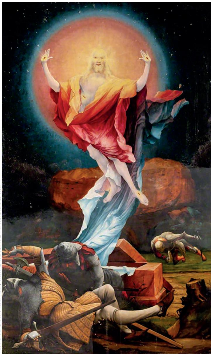
MATTHIAS GRÜNEWALD: A FELTÁMADÁS (RÉSZLET AZ ISENHEIMI SZÁRNYS OLTÁRRÓL: 1512-1516)

Ha annyi hitünk lenne, mint egy mustármag, akkor szükség esetén egy-egy hegyet is odébb küldhetnénk. Az Úr itt a korabeli rabbinista, költőien túlzó megfogalmazást használja: „Bizony mondom néktek, hogy aki azt mondja ennek a hegynek: Emelkedjél fel, és vesd magadat a tengerbe! – és nem kételkedik szívében, hanem hiszi, hogy amit mond, az megtörténik –, annak meg is adatik az.” (Mk 11,22–23) A gondolatot Pálnál is megtaláljuk a szeretet himnuszának elején: „...ha teljes hitem van is, úgyhogy hegyeket mozdíthatok el...” (1Kor 13,2) Az így ható hit persze a rendkívülinél is rendkívülőbb karizma (1Kor 12,9) lenne. De nem tarthatjuk eleve kizártnak, hogy valahol, vala-