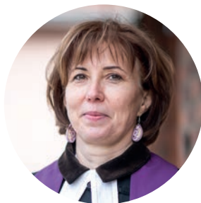
Ihsz Beatrix esperes Soproni Evangélikus Egyházmegye