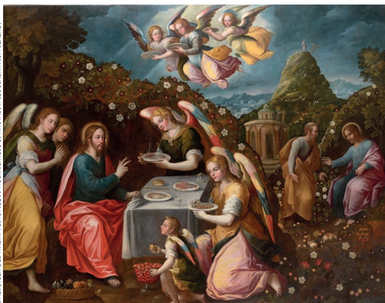
ISMERTETLEN DÉL-ITALIAI FÉSTŐ: JÉZUS MEGKÍSÉRTÉSE ÉS ANGYALOK SZOLGÁLATA (17. SZÁZAD)

Példakép a szenvedésben. Vajon hogyan tudnék imádkozni egy végtelen, örök Mindenhatóhoz, ha nem tudom, hogy azt a szenvedést, azt az emberi sorsot ő is átélte Krisztus, az én testvérem által? Ő az, aki végső kintartásra biztat, mert ő az, aki átélte, megélte ugyanezt.