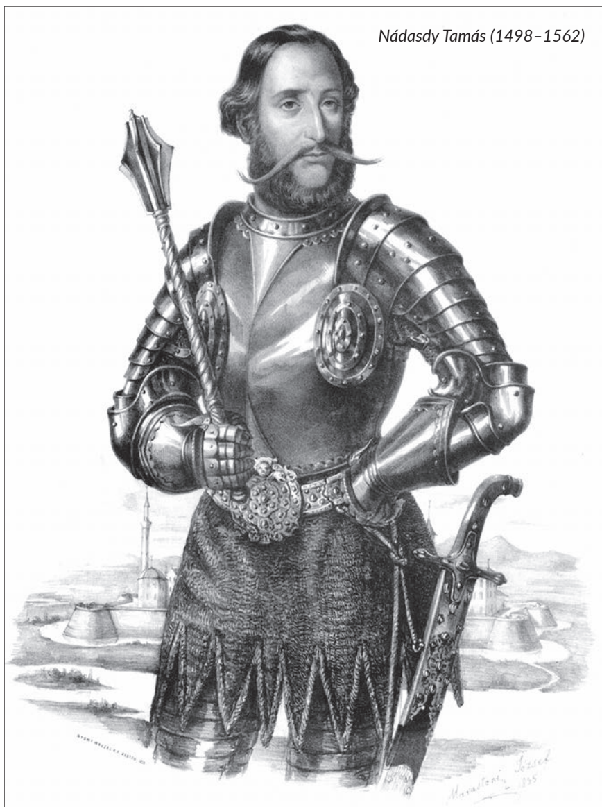
Nádasdy Tamás (1498-1562)

Sokat idézett forrás még Nádasdynak egy 1560. december 11-én Bécsben kelt levele. Ebben így tudósítja a feleségét: „Meglátogatott továbbá pápa követe, és ede hozzám jött. Hitire, tisztességére azt mondta, hogy pápa énnékem ezt s ezt üzenté. Tudja ő szent atyasága, hogy nem vagyok én luther, de meglátja úszentsége, hogy az lutherök ellen szolgálni akarok néki.” Bár Stanislaus Hosius nuncius jelentéseiben nem találjuk nyomát az ügynek, ez nem jelenti azt, hogy nem is egyeztetett Rómával. Felmerül viszont az a gyanú, hogy a nuncius saját szavainak úgy próbált nagyobb nyomtatékot adni, hogy a legfelsőbb egyházi tekintélyre hivatkozott a nádor előtt. ►