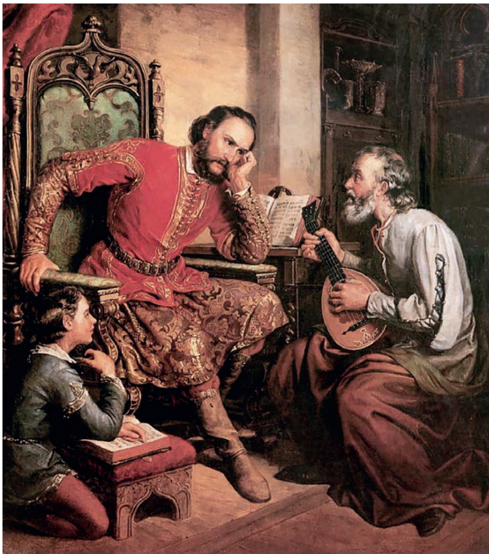
Orlai Petrich Soma festménye: Nádasdy Tamás nádor és Tinódi

Felmerül ugyanakkor a kérdés, hogy ha Nádasdy valóban el kívánta titkolni az új hitértelmezéshez fűződő viszonyát, miért nem elégedett meg egy csendes házi lelkész alkalmazásával, s miért alapított nyomdát, iskolát, küldte Wittenbergbe a környezetében élőket. Elgondolkodtató az is, hogy mennyire reális az