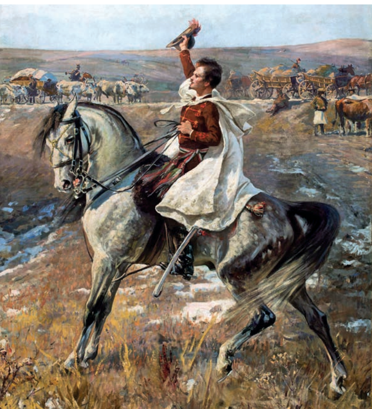
PETŐFI LOVAS PORTRÉJA (1897 KÖRÜL) - JAN STYKA

Petőfinek nemigen volt 21. századi értelemben vett magyar nemzetiségű tanára: Schiffendecker, Haag, Lehr, Jeszenszky, Stuhlmüller, Kollár, Koren, Lichard tanár urak legtöbbször nemcsak a neve, de az anyanyelve is idegen volt. Olyan is akadt köztük, aki nem vagy alig-alig tudott magyarul, és persze olyan is, aki Berzsenyi verseivel oktatta a magyar nyelvet. A 19. század elején a nyelvtudás és a nemzettudat nem mutatott olyan szoros egybeesést, mint ahogyan ma megszoktuk. Az iskolai életben egyébként is a latin nyelv volt a legfontosabb.