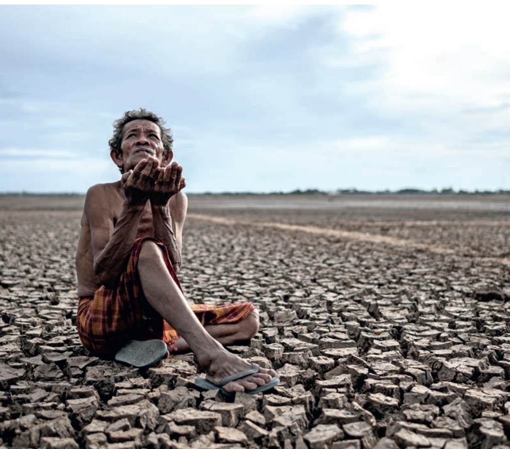
KÉPINK ILLUSZTRÁCIÓ – FOTÓ: FREEPIK.COM

Nem értette volna ezeket: klímatastiztrófa, rasszizmus, orosz–ukrán háború, woke, lmbtq , cancel culture , Black Lives Matter , és így tovább. És a koronavírus sem... ha még emlékszik ez utóbbira közülünk valaki. Aztán itt ez a mesterséges intelligencia (MI)! Kipróbáltam. Hosszabb cseteléseket folytattam vele, egyetlen üzenetváltást idézek: