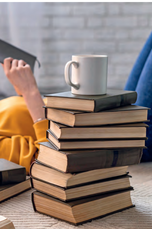
KÉPÜNK ILLUSZTRÁCIÓ - FOTÓ: FREPIK.COM