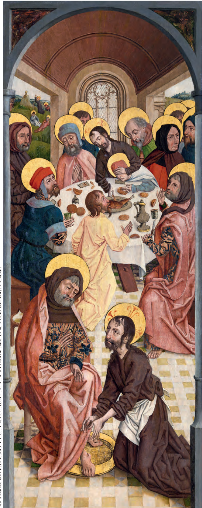
ÉSZAKFRANCIA VAGY DÉLHOLLAND NÉVTELEN MESTER: JÉZUS MEGMOSSA TANTÁVANYAI LÁBÁT ÉS AZ UTOLSÓ VACSORA (15. SZÁZADI)

Újra és újra figyelmeztetjük magunkat: hé, ember, nem te találtad fel a spanyolviaszt, nem a te tudásod, véleményed hozza létre az evangéliumot – te csak látod, megéled, de nem te csinálod. Túlmutat rajtad – épp ezért tudsz hozzá ragaszkodni.