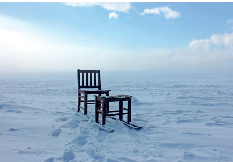
KÉPUNK ILLUSZTRÁCIÓ