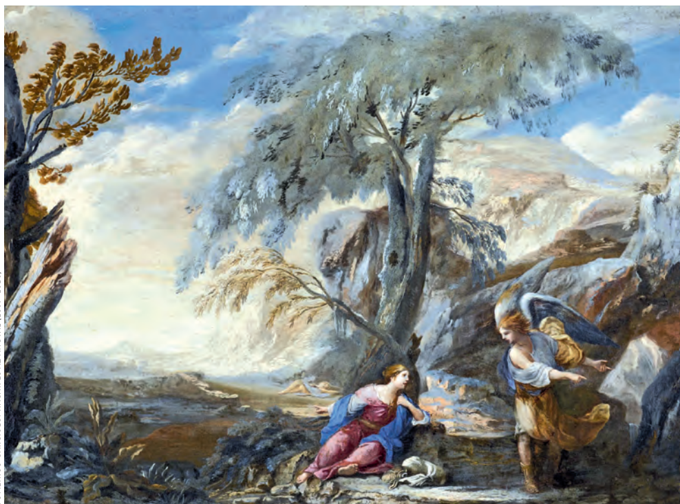
DOMENICO GARGIULO: HÁGÁR ÉS AZ ANGYAL (1609-1610)

Am az is megkerülhetetlen kérdés, hogy egész világunkon segíthetne-e, ha