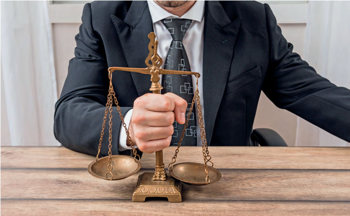
KÉPEINK ILLUSZTRÁCIÓK