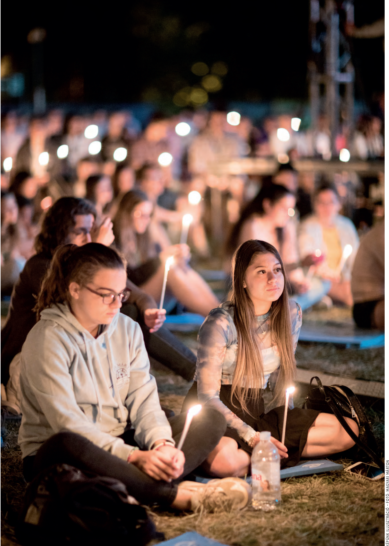
KÉPUNK ILLUSZTRÁCIÓ