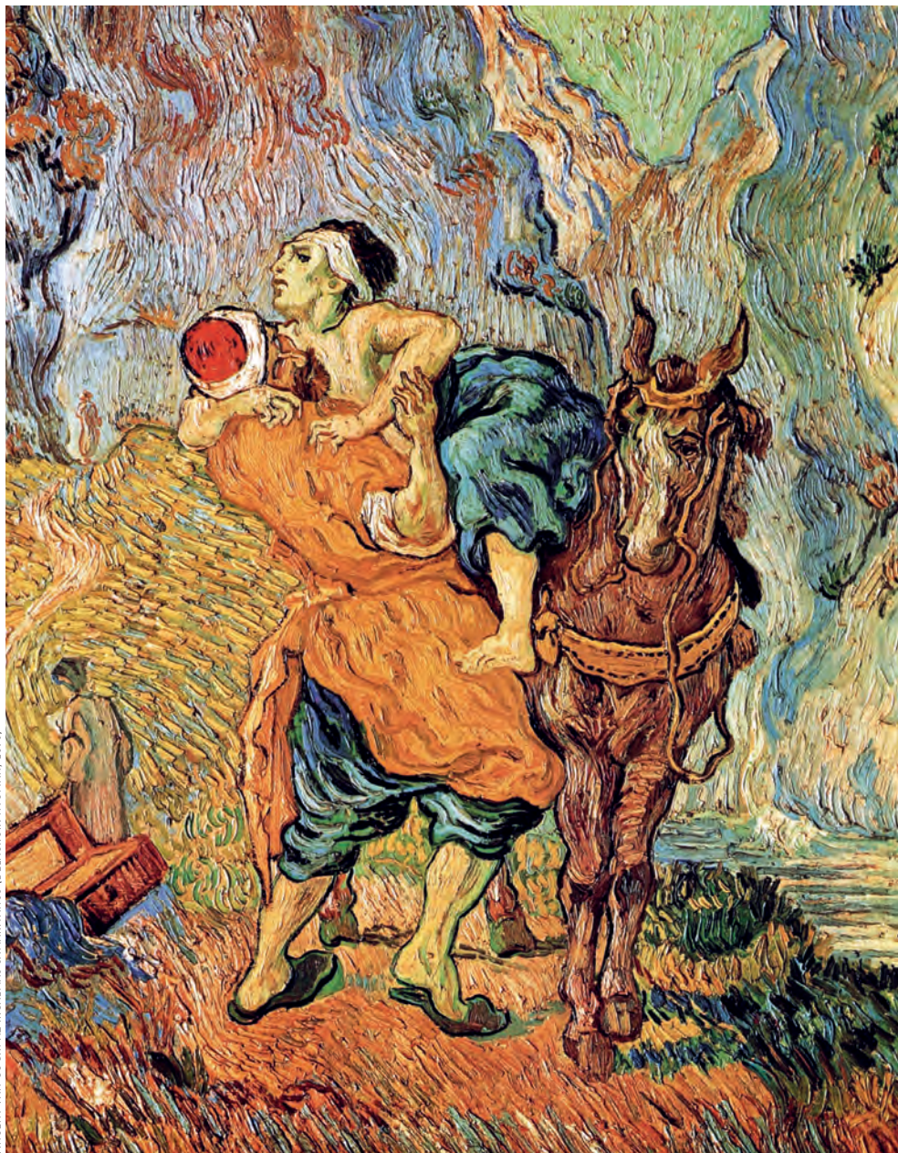
VINCENT VAN GOGH: AZ IRGALMAS SAMARITÁNIUS IDELACROIX NYOMÁN. 1890

Gyülekezeteinkben elterjedt az a nézet, hogy a megszólítás, mások hívogatása lelkési feladat. Az eddigi említett példák