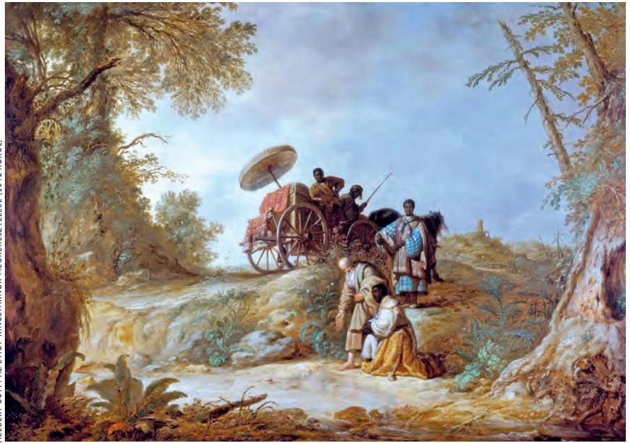
ALBERT CUYP: AZ ETIÓP KINCSTÁRNOK MEGKERESZTELÉSE (1642 KÖRÜL)

nál. Ahol megtöretik a kenyér, ahogyan a lukácsi párhuzamos történetben az emmausi tanítványok drámai asztalközösségében. Ahol helye van az etióp kincstárnoknak, eunuchnak is. Neki is esély adatott, hogy Fülöphöz hasonlóan az Írás alapján