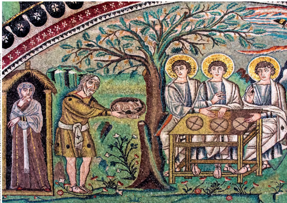
ABRAHÁM VENDEGSZERETETE (MOZAIKRÉSZLET A RAVENNA SAN VITALE-TEMPLOMBAN)