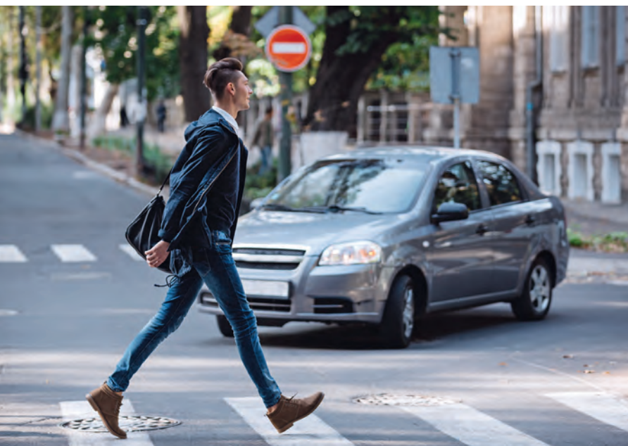
KEPŐNK ILLUSZTRÁCIÓ

Az első nagy parancsolat megtartása látszólag könnyebb lehet, mert hívőként Istent szeretni elvileg nem jelent nagy gondot. Sőt Isten maga a szeretet – még jó, hogy szeretem. A második nagy parancsolat szerint embertársainkat kellene szeretnünk. Azokat is, akik rosszat akarnak nekünk, vagy akaratlanul, de végül mégis rosszat tesznek velünk. Aztán olyanokat is, akik valamiért idegesítenek, és ennek megfelelően az e világi gyakorlat szerint haragszunk rájuk, de legalábbis rájuk förmedünk.