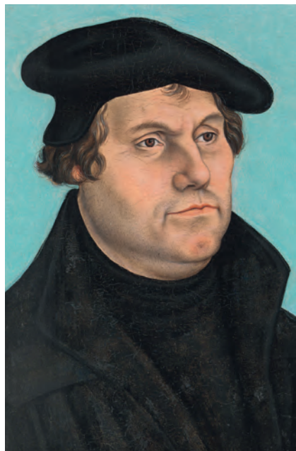
LUTHER MÁRTON PORTRÉJA – IDŐSEBB LUCÁS CRANACH MŰHEVE (TALÁN 1532)

a régi napokra, végiggondolom minden tet- tedet, elmélkedem kezéd alkotásain.” (Zsolt 143,5) „Visszagondolok hajdani csodáidra.” (Zsolt 77,12) Továbbá: „Ha ősrégi dönté- seidre gondolok, megvigasztalódom, Uram!” (Zsolt 119,52) Ezek és hasonló mondá-