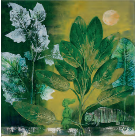
TESTRŐL ÉS LÉLEKRŐL "Szemből nézve a testről, azaz a testről és a lélekről." (Közzététel)

evangélikus folyóirat | XVIII. ÉVFOLYAM 2023. JANUÁR | 1050 PF