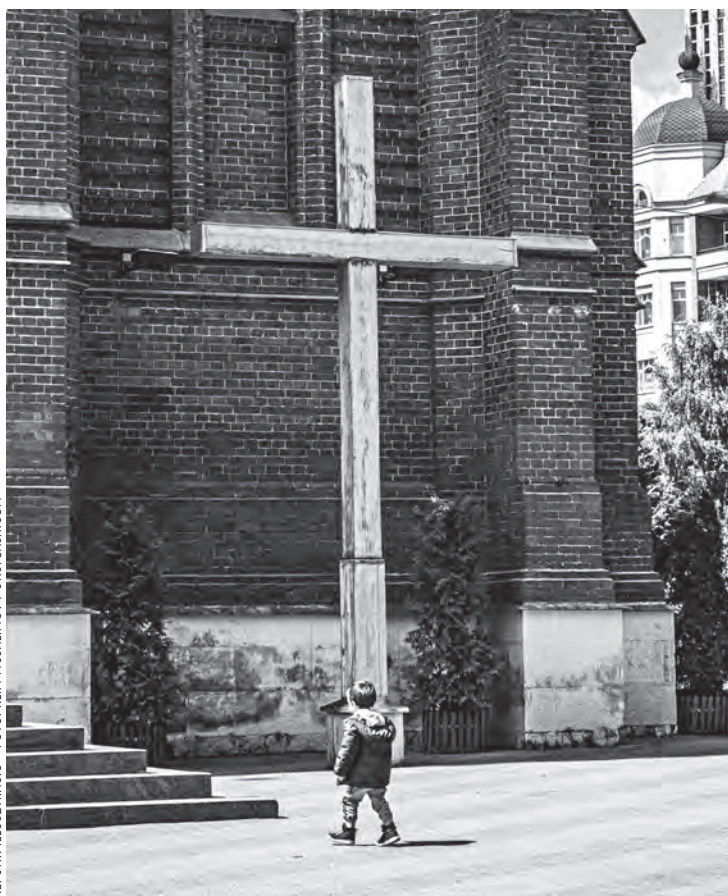
KÉPÜNK ILLUSZTRÁCIÓ

Önámítás helyett. Amikor Jézus azt mondja, hogy „betölteni” jött a törvényt, minden korábbit megtartva egy teljesen új szemléletet hoz: a szabályok keretrendszeréről a céljukra helyezi a fókuszot. Sem a kereteken, sem pedig a célon nem változtat, a hangsúly áthelyezése mégis gyökeresen megváltoztat mindent: Istennek az emberek iránti végtelen szeretetét helyezi a középpontba. Ennek következményeként fogalmazódhat meg az emberben az Isten akarata szerinti életre törekvés.