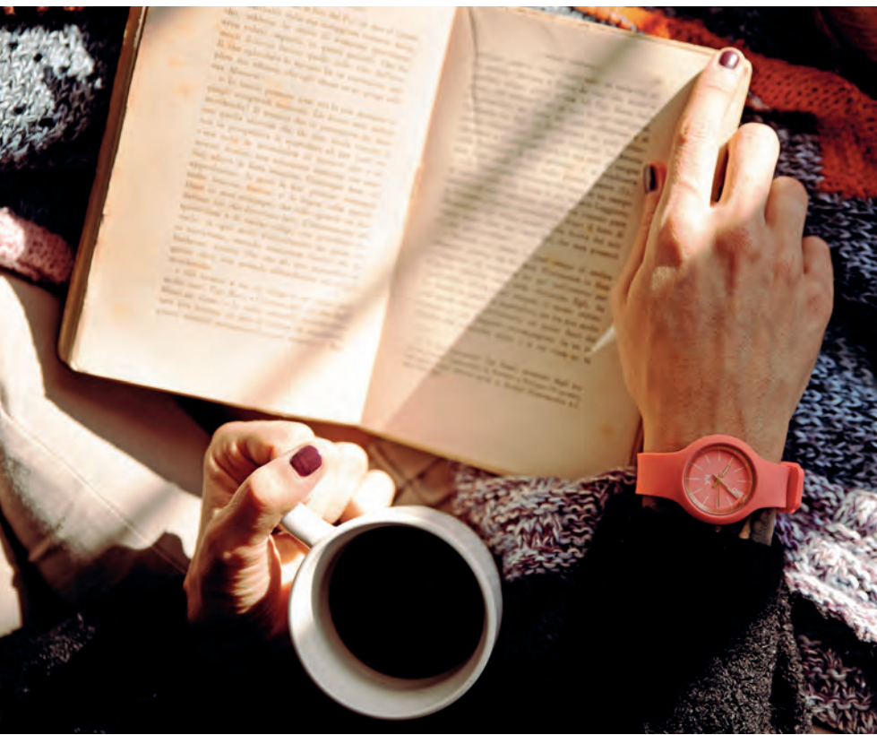
KÉPUNK ILLUSZTRÁCIÓ - FOTÓ: VINCENZO MALAGOLI / PEXELS.COM