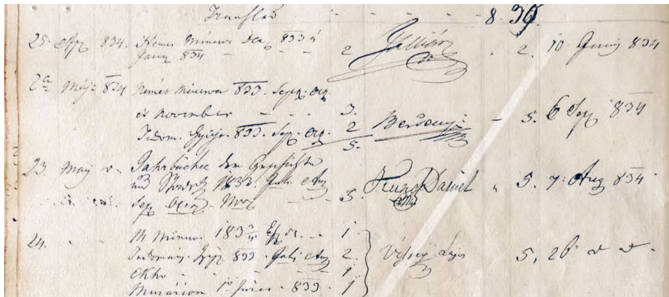
Részlet az Olvasó Társaság kölcsönzési naplójából, 1833–1834