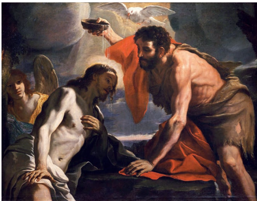
MATTIA PRETI: KRISZTUS MEGKENÉSE

A Lélek érkezik, és arra bátorít minket, hogy válasszunk, hogy döntsünk. A Lélek – amit a héber nyelv a ruah szóval ír le – ott van a teremtésnél, és lebeg a vizek felett, ott van oly sok történet és dráma mélyén, arra kér, hogy merjünk újra a bizalmunkkal az Örökkévaló felé fordulni. Arra kér, hogy a hitünket abba az Istenbe vessük, aki Fia ígérete szerint Fiával együtt elküldte a Lelket azon a bizonyos első pünkösdkor Jeruzsálemben, de elküldi mindazoknak, akik kérik, ma is. Ahogyan Dávidot megszállta, ahogyan Jézust megszállta a Jordánban, ahogyan a háromezer embert megszállta Jeruzsálemben az első pünkösdkor. Isten élő Lelke, jöjj, áldva szállj le ránk, szállj meg minket! – szólhat fohászkodunk ma is az égig.