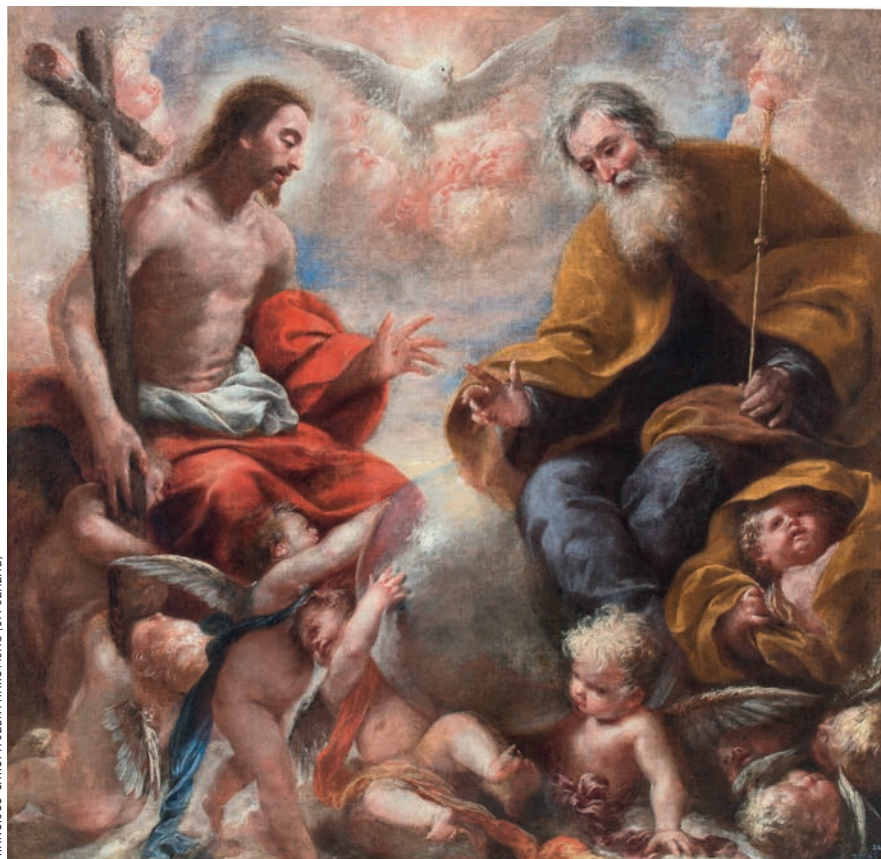
FRANCISCO CARO: A SZENTHÁROMSÁG (17. SZÁZAD)

A hosszú iskolai szünetidő és a munkával jogosan kiérdemelt szabadság heteinek ígésében marad-e