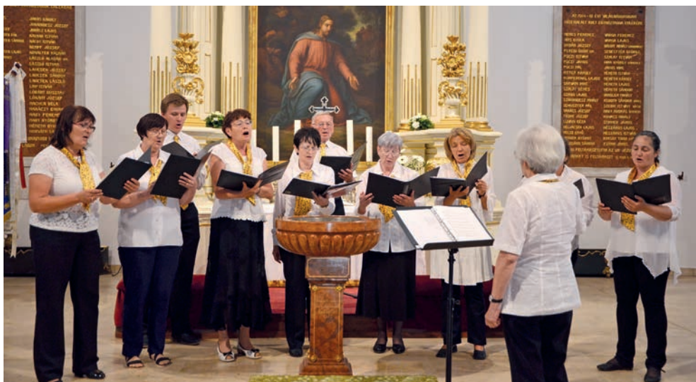
A székesfehérvári gyülekezet énekkara

A Covid-járvány életünk minden színterén nagy veszteségeket okozott, de legerőteljesebben talán az énekkarokat sújtotta. Ezért volt nagy öröm, hogy a Magyarországi Evangélikus Egyház Egyházzenei Bizottsága május 21-22-én Győrben országos kórustalálkozót rendezhetett. Itt megjelenhettek azok az énekkarok, amelyek már kellően megerősödtek a kényszerű szünet után.