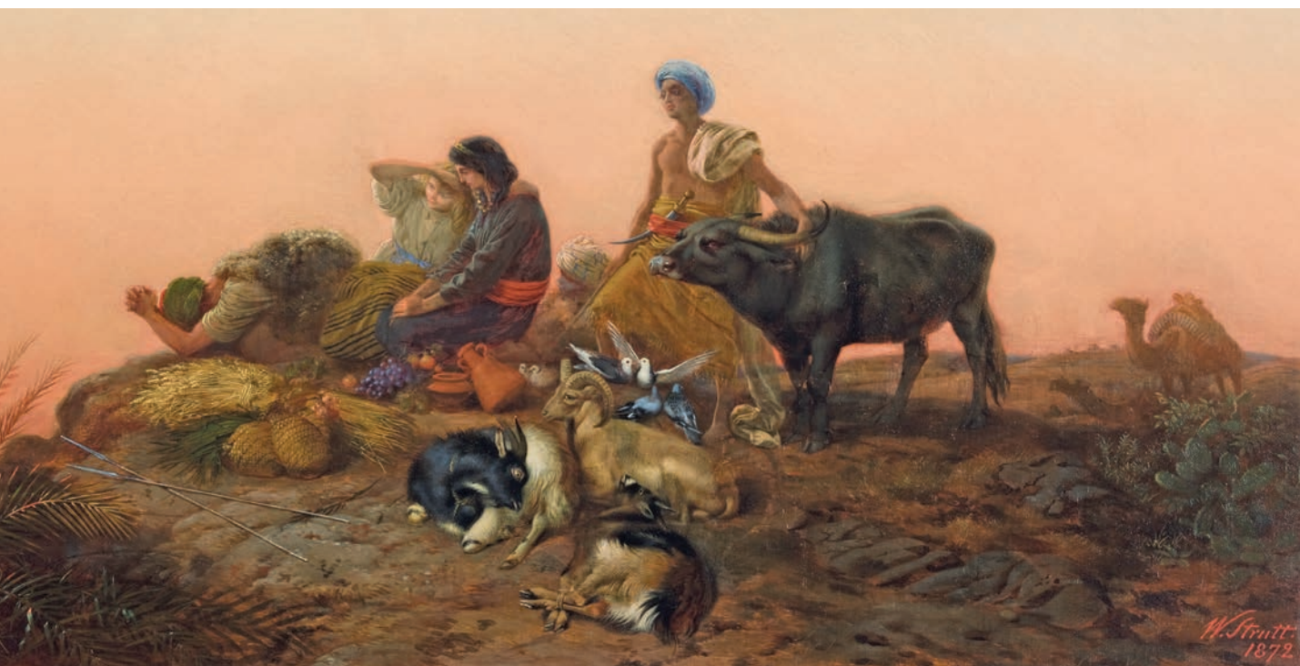
Zarándokok Jeruzsálem felé