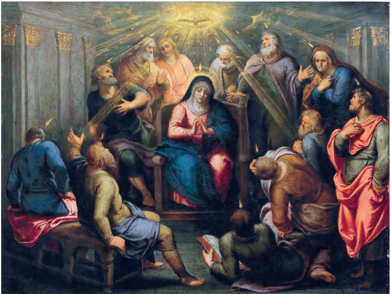
OTTO VAN VEEN: PÜNÖSD (17. SZÁZADI)