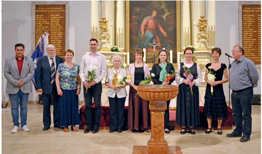
A szervezők és a karvezetők