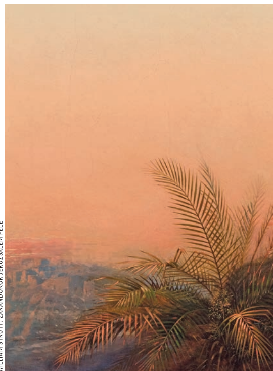
WILLIAM STRUTT, ZARÁNDOKOK JERUZSÁLEM FELÉ

– Az ószövetségi tradícióban mindig a teljességgel, az Isten teremtési rendjével függ össze. Ha az első teremtésbekezdésből indulunk ki, amelyben Isten megpihen a hetedik napon, akkor észrevehetjük, hogy ez a struktúra tükröződik a hetek ünnepének a háttérében is, hiszen hétszer hét nap telik el húsvét után, míg eljutunk savuot hoz, a tavaszi betakarítási ünnephez.