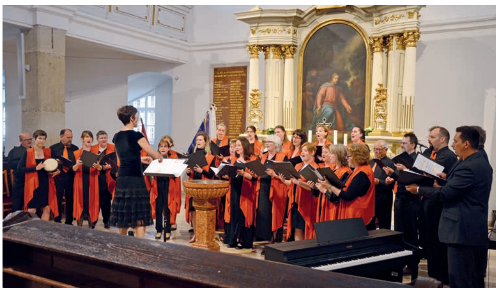
A maglódi Magdala kórus

Legutóbb a reformáció emlékévében, 2017-ben Szarvason volt országos kórustalálkozó. Az esemény sikerétől lendületet kapva a következő találkozót 2020-ra terveztük, de ez a korlátozások miatt nem valósulhatott meg. A kihagyott két év alatt volt alkalmunk átgondolni, hogyan is működhetne rendszeresen ez a program.