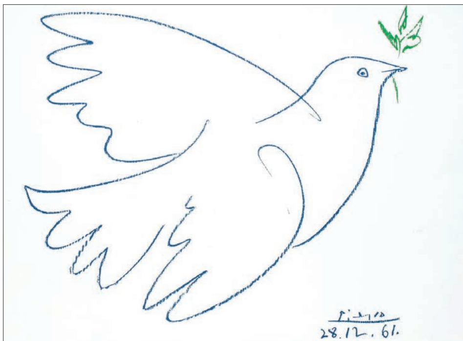
PABLO PICASSO: BÉKEGALAMB (1941)

múlva megszülető generáció tagjai se kezdjenek soha többet (világ)háborúba?