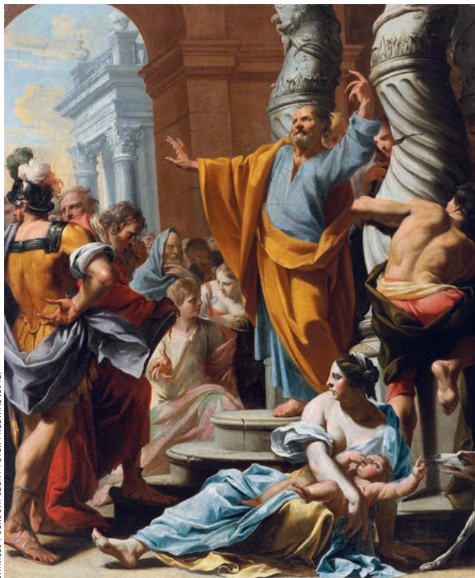
CHARLES POERSON: SZENT PÉTER PRÉDIKÁL (1642)

Formálódtak egymás után a mondatok, a gondolatok, hogy aztán egyszer csak életre keljenek.